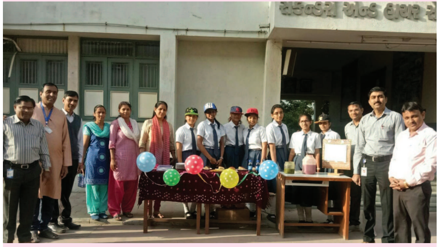
શ્રીમતી આર. સી. પટેલ સ્કૂલ દ્વારા આનંદ મેળાનું આયોજન કરવામાં આવ્યું હતું. શાળાનાં પ્રાંગણમાં આનંદ મેળો યોજાયો હતો.