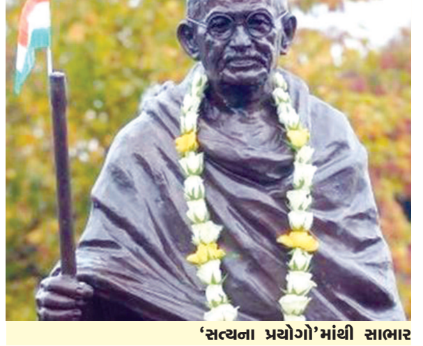
'સત્યના પ્રયોગો'માંથી સાભાર

હું નાંઠો. મને યાદ નથી કે અસીલ જીવ્યો કે હાર્યો. (કમશ:)