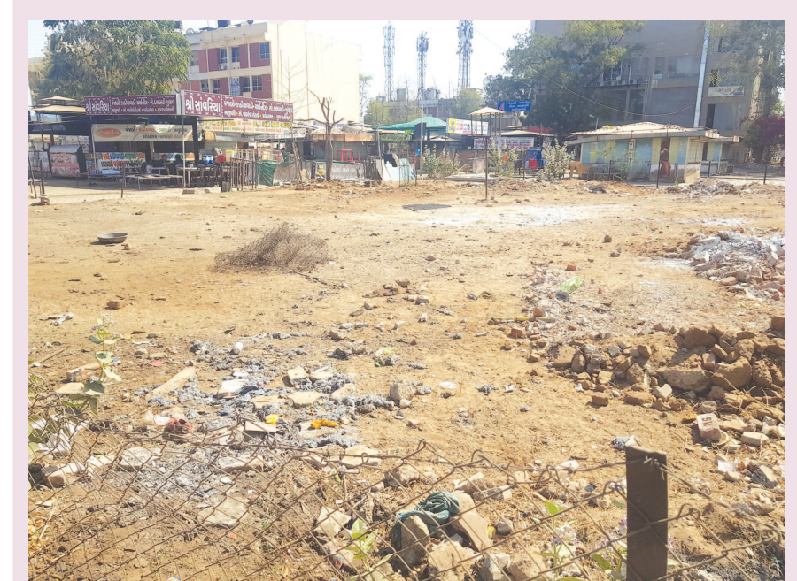
શહેરના હાઈવેમાં વિસ્તારમાં સ્થિત ખાણીપીણી બજારમાં અત્યાર સુધી ફાળવવામાં ન આવેલી દુકાનો પણ ખંડેર હાલતમાં જોવા મળી રહી છે. જ્યારે આ વિસ્તારમાં ઓપન એર થિયેટર પણ ઉપયોગના અભાવ વચ્ચે બિસ્માર જોવા મળી રહ્યો છે. ત્યારે ખાણી પીણી બજારમાં સ્થિત નાના બગીચાને પણ તંત્રની લાપરવાહીના લીધે આ બિમારી લાગી ગઈ છે. જાળવણીના અભાવે ગંદકીનુ કેન્દ્ર સ્થાન બનતા ઉદ્યાનની હરિયાળી પણ વેરાન થવા તરફ છે.