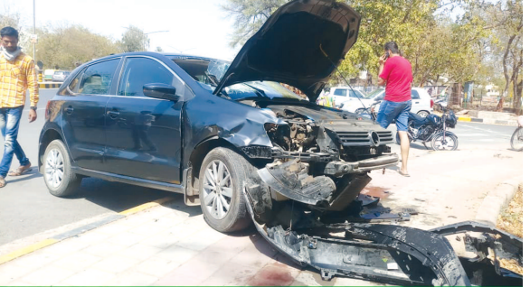
ગાંધીનગર શહેરના મુખ્ય માર્ગ પર ૨૨-૨૩ કોસ રોડ પર બપોરના સુમારે માર્ગ પરથી પસાર થઈ રહેલી કાર ચાલકે અચાનક કાર પરનો કાબુ ગુમાવતા કાર માર્ગની બાજુમાં ડીવાઈડર પર ધસી ગઈ હતી. આ અકસ્માતમાં કારના આગળના ભાગનો ભુસ્કો બોલાઈ ગયો હતો. જો કે સહનસીબે આ બનાવમાં કોઈને ઈજા પહોંચી ન હતી. અકસ્માતના બનાવને પગલે તંત્ર દ્વારા ગતિ નિયમન યોગ્ય રીતે જળવાય તે જરૂરી બન્યું છે.

૧૦ જેટલી એલઈડી લાઈટ ફીટ કરવામાં આવતા સમગ્ર કેમ્પસમાં ઝળહળી ઉઠશે. ૬૦૦ બેડની પાછળના ભાગે તેમજ તાકાલીક વિભાગની બાજુમાં સહિતના સ્થાનો પર એલઈડી લાઈટના ઓજસ પથરાશે. ત્યારે સ્ટ્રીટ લાઈટમાં ૪૦ વોટની એલઈડી લાઈટ ફીટ કરવામાં આવી હોવાથી વધુ પ્રકાશ પથરાશે અને વિજબિલમાં પણ લાભદાયી નિવડશે.