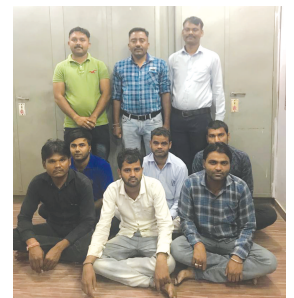
તેમજ એક સીએનજી રીક્ષા નાં. જી. જે. ૨૭. યુ. ૪૫૬૬ કિ.રૂ. ૧૫૦૦૦ મળી કુલ કિ.રૂ. ૪૬,૨૦૦નો મુદામાલ કબ્જે કરી કાર્યદેસરની કાર્યવાહી કરવામાં આવી છે.

ગાંધીનગર, તા. ૧૭ ફાગણી પૂનમ આવી રહી છે ને ભકતો ડાકોર પગપાળા જઈ રહ્યા છે. આકાશ સમાજ સેવા ટ્રસ્ટ દ્વારા દર વર્ષની જેમ આ વર્ષે પણ મહુડા-અલીપા-ડાકોર ભકિત માર્ગે ‘કદમ છાયા’ સેવા સંકુલમાં સેવા કેન્દ્રનું આયોજન કરવામાં આવ્યું છે. જ્યાં જલસેવા તથા ટોપી વિતરણ કરવામાં આવી રહ્યું છે. મીયાપુર-અલીયા, સરદારપુરા તથા જાળીયા ગામના યુવાનો પણ સેવા કેન્દ્રમાં સહભાગી બન્યા છે.