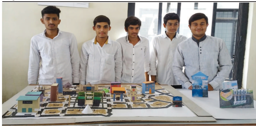
કડી સર્વ વિદ્યાલય સંચાલિત વી.પી.એમ.પી. પોલિટેકનીક કોલેજ ખાતે ફાઈનલ સેમેસ્ટરના વિદ્યાર્થીઓ દ્વારા દર વર્ષની જેમ સિવિલ, કમ્પ્યુટર, મિકેનિકલ અને ઈલેક્ટ્રીકલ ડિપાર્ટમેન્ટના વિદ્યાર્થીઓ દ્વારા ઉત્કલ ડેવલપમેન્ટ ઓફ વેલ પ્લાન્ટ સિટી ગાંધીનગર, રેઈન વોટર હાર્વેસ્ટીંગ જેવા વિષયો પર મોડલ બનાવી કોલેજ સમક્ષ પ્રસ્તુત કરવામાં આવ્યા હતા.

ગાંધીનગર, તા. ૨૯ ઈન્સ્ટિટ્યુટ ઓફ મેનેજમેન્ટ-એનઆઈસીએમ કેમ્પસ ખાતે સવારે ૮ થી બપોરના ૧૨ કલાક દરમિયાન હેમ્પી યુથ ક્લબના સહયોગથી સ્વેચ્છિક હેમ્પી રકતદાન કેમ્પનું આયોજન કરવામાં આવ્યું છે. ભારતના વીર શહીદ જવાનોને શ્રધ્ધાંજલિ અર્પણ કરવા સાથે યુવાનોમાં રકતદાન જેવી સેવાકીય પ્રવૃત્તિ અંગે જાગૃતિ ફેલાવવા તેવા હેતુથી આયોજિત રકતદાન શિબિર સાથે વિના મૂલ્યે આંખની તપાસનો કેમ્પ પણ યોજાશે. રકતદાન કેમ્પમાં રકત એકત્ર કરવાની રકત કલોલની ઈન્ડિયન રેડક્રોસ સોસાયટી તથા આઈચેક અપ કેમ્પમાં આંખની તપાસ કરી આપવાની સેવા અમદાવાદની દિવા આઈ ઈન્સ્ટિટ્યુટ દ્વારા પુરી પાડવામાં આવશે. સંસ્થા દ્વારા રકતદાન કેમ્પમાં સામેલ થઈ રકતદાન કરનાર તમામ રકતદાતાઓને પ્રમાણપત્ર તથા શુભચ્છા ભેટ આપી સન્માનવામાં આવશે. આ રકતદાન કેમ્પમાં ઉત્સાહપૂર્વક રકતદાન કરવા શહેરના રકતદાતાઓને આયોજકો તરફથી જાહેર અનુરોધ કરવામાં આવ્યો છે.