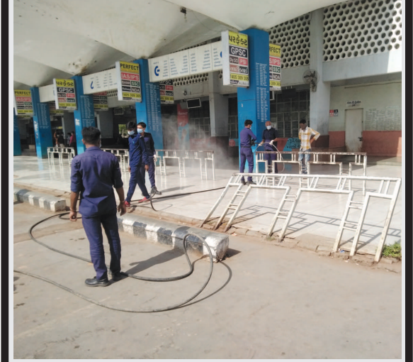
ગાંધીનગર તા ૧૮ ગાંધીનગરમાં કોરોનાની મહામારીના એક વર્ષના કપરાકાળ દરમિયાન ફાયરબ્રિગેડની ટીમે સરકારી કચેરીઓ તેમજ રહેણાંક વિસ્તારમાં સેનેટાઈઝિંગની ઉમદા કામગીરી કરી છે. આગના બનાવોમાં જાનમાલને બચાવવા સહીત અબોલ પશુ પશીઓનો જીવ પણ બચાવી માનવતાનું ઉદાહરણ પુરુ પાડ્યું છે. ફાયર બ્રિગેડની ટીમે કોરોનાના સંક્રમણના ખતરા વચ્ચે પણ જાન આરોગ્ય સુધાકારીને ધ્યાનમાં રાખી સતત પોતાની ફરજ નિભાવી છે. કોરોના સામેની આ લડત દરમિયાન અત્યાર સુધી ફાયર ઓફિસના એક કર્મચારીને પણ કોરોના થતા સારવાર લેવાની ફરજ પડી હતી. ફાયર ઓફિસર તેમજ તેમની ટીમે છેલ્લા એક વર્ષમાં શહેરમાં અંદાજિત ૮ હજાર જેટલા મકાનોને સેનેટાઈઝ કરવાની કામગીરી કરી છે. બિહારીંગ તેમજ મકાનોને સેનેટાઈઝ કરવાની આ કામગીરીમાં ફાયર ટીમે ૭ હજાર લીટર સોડિયમ હાઈપોક્લોરાઈડ કેમિકલનો છંટકાવ કર્યો છે. અત્યાર સુધી આ ઉપરાંત નગરની તમામ સરકારી કચેરીઓ અને સેક્ટરોની શેરીઓમાં પણ દવાનો છંટકાવ કરી કર્મચારીઓ અને નાગરિકોને સંક્રમણથી બચાવવા માટે મેડિકલ ઈમરજન્સીમાં ખરેખરે ફરજ નિભાવી છે. ફાયર બ્રિગેડની ટીમના ૫૦ કર્મચારીઓનો સ્ટાફ અને ચાર વાહનો આ અભિયાનમાં કામે લાગેલા છે. છેલ્લા એક વર્ષથી કોરોના વોરિયર્સ તરીકે કામ કરતી આ ટીમના કેટલાક સભ્યોને ચામડીની તકલીફ પણ થઈ ગઈ હોવાથી સારવાર લેવાની ફરજ પડી હતી. ફાયર ઓફિસર મહેશ મોડ જણાવે છે કે આ કામગીરી દરમિયાન લોકડાઉનના સંજોગોમાં પણ ફાયર સ્ટાફ માટે સે-૨ સ્વામિનારાયણ મંદિર તેમજ રાધે રાધે ગુપ્તવાસ તેમજ ચા નાસ્તાની સેવા પુરી પાડી હતી તેમના પણ આભારી છીએ.