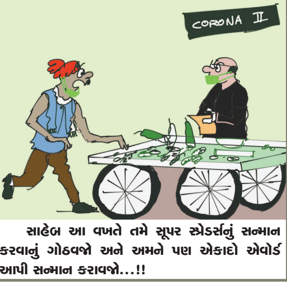
સાહેબ આ વખતે તમે સુપર સ્ટોર્સનું સન્માન કરવાનું ગોઠવણે અને અમને પણ એકાદો એવોર્ડ આપી સન્માન કરાવજો...!!