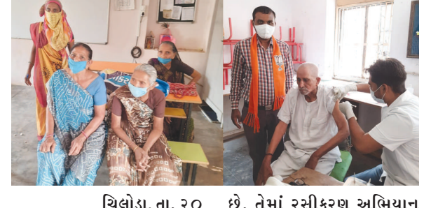
આપવા માટે સોમવારથી શનિવાર સુધી આપવામાં આવે છે અને રવિવારે રજા હોય છે. પરંતુ હાલ રાજ્યની હાલતને જોતા આવતીકાલે (રવિવારે) પણ કોરોના રસીકરણ ચાલુ રહેશે તેવી જાહેરાત કરી છે. આજે ઉપ્પટ્ટી સીએમ નીતિન પટેલે વિધાનસભા ગૃહમાં જાહેરાત કરતા જણાવ્યું હતું કે, ગુજરાતમાં ૨૫% સેન્ટર પરથી આવતીકાલે (રવિવારે) કોરોના રસીકરણ કરવામાં આવશે. જેથી રાજ્યના

ચિલોડા, તા. ૨૦ કોરોના સંક્રમણમાં ચિંતાજનક વધારો સર્જતા આવી સ્થિતિમાં રસીકરણ ઝડપી બનાવવા સરકારે કમર કરી છે. ત્યારે ગાંધીનગર તાલુકાના ચિલોડા મોટા પ્રાથમિક શાળામાં પ્રાથમિક આરોગ્ય ટીમ દ્વારા ગામના વડીલો, જેઓ ૬૦ વર્ષથી વધુની વય ધરાવે છે. તેમાં રસીકરણ અભિયાન અંતર્ગત પહેલા દિવસે ૯૫ જેટલા વયસ્કોએ રસીકરણ કરાવ્યું હતું. રસીકરણનો આ કાર્યક્રમ તા. ૩૧મી માર્ચ સુધી સવારે ૯.૩૦ થી ૫ વાગ્યા સુધી ચાલવાનો છે. જેનો લાભ લેવા આરોગ્ય ટીમ દ્વારા ગ્રામજનોને અનુરોધ કરવામાં આવ્યો છે.