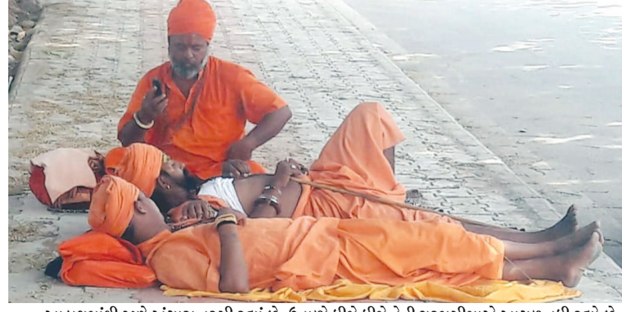
આકાશમાંથી જાણે અંગારા વરસી રહ્યાં છે. ઉનાળો ધીમે ધીમે તેની ચરમસીમાએ આગળ વધી રહ્યો છે. દિવસ દરમિયાન તો એટલો તડકો લાગે છે કે તડકામાં બહાર નીકળવું મુશ્કેલ બને છે. સંસારજીવન ત્યાગીને ફરતા રહેતા સાધુ-સંતોને પણ આકરી ગરમી હેરાન પરેશાન કરી રહી છે. બપોરના સમયે વિહાર કરવાના બદલે તેઓએ ફૂટપાથ પર આરામ કરવાનું વધુ મુનાસીબ માન્યું હતું.

જીગ્નેશ મેવાણીની આગેવાનીમાં વિધાનસભા તરફ કુચ કરી ગેટ નં-૧ પાસે વિરોધ પ્રદર્શનનું આયોજન કરાયું હતું. પરંતુ તે પહેલા જ સુત્રો પાસેથી મળતી વિગત મુજબ સાણોદર ગામે ચૂંટણીના વિજય સરઘસમાં ગામના અમરાભાઈ બોરીયાની હત્યા થઈ હતી. જેમાં કેટલાક વ્યક્તિની સંડોવણી બહાર આવી હતી તેમજ ફરજમાં બેદરકારી દાખવનાર સ્થાનિક પીએસઆઈની પણ ધરપકડની માંગ ઉઠવા પામી હતી. સમગ્ર દલિત સમાજમાં આ હત્યાને પગલે ભારે રોષ જોવા મળી રહ્યો છે. ત્યારે તા. ૨૩ માર્ચ શહીદ દિન નિમિત્તે ધારાસભ્ય જીગ્નેશ મેવાણીની આગેવાની હેઠળ પીએસઆઈ સોલંકીની ધરપકડની માંગ અને પીએસઆઈ ભરતીમાં એસસી, એસટી, ઓબીસી અને અનામત ખતમ કરવાના વિરોધમાં સચિવાલયના ગેટ નં-૧ પાસે વિરોધ પ્રદર્શનનો કાર્યક્રમ રાખ્યો હતો. નાગરીકોનો આક્રોશ જોઈને શહેરના એમએલએ કવાર્ટર અને સચિવાલયના ગેટ પાસે ચાંપતો બંદોબસ્ત ગોઠવી દેવાયો હતો. ધારાસભ્ય જીગ્નેશ મેવાણી અને ભીમસેનાના કાર્યકરોએ સુત્રોચ્ચાર કરીને ગેટ સામે કુચ કરી હતી. આ સમયે ધારાસભ્ય સહિતને ૬૦ જેટલા ભીમસેનાના કાર્યકરોને અટકાવીને પોલીસ અટકાયત કરી લઈ જવાયા હતા.