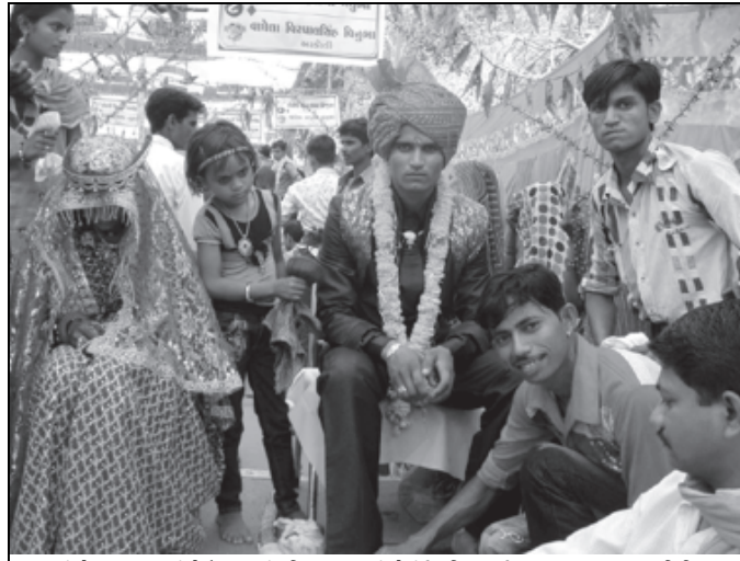
કાંકરેજ તાલુકાના કંબોઈ નગરમાં ક્ષતિય સમાજનાં સોલંકી પરિવાર શ્રી બહુચર સમૂહ લગ્ન સમિતિ દ્વારા ૩૮ યુવકોએ સંતો મહંતો અને સમાજના મહાનુભવોની હાજરીમાં લગ્નગ્રંથિથી જોડાયા હતા. આ પ્રસંગ ક્ષતિય સમાજના આગેવાનો તેમજ સંતો-મહંતો અને અન્ય રાજ્યકારણી નેતાઓની હાજર હતા અને વિશાળ સંખ્યામાં ક્ષતિય બંધુઓએ આ અવસરનો લાભ લેવા પધાર્યા હતા.