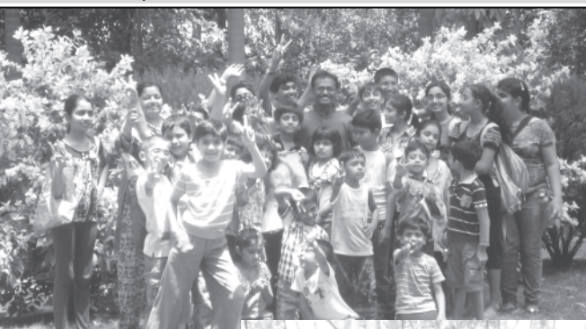
આર્ટ ઓફ લીવીંગ સંસ્થા દ્વારા વિવિધ કાર્યક્રમ યોજાયા

પ્રાર્થના તેમજ શ્રાદ્ધ પઠવમાં શ્રાદ્ધ વિધિ કરાવી તેનું તર્પણ કરવાનું કામ આ સંસ્થા જ કરી શકે. આજ સુધી ૫૦૦ ઉપરાંત બિનવારસી લાશોના અંતિમ સંસ્કાર જુસિકાએ કરાવ્યા છે. આ સંસ્થા તરફથી અંતિમ સંસ્કારના સામાનની કીટ પણ વિના મૂલ્યે આપવામાં આવે છે. વિશેષમાં ઓબડવેશન હોમના કે બહેરા મુંગા બાળકોને પ્રવાસ, બુટ, મોજા, સ્વેટરનું પણ વિતરણ કરી તથા વુદ્ધાશ્રમના વડીલોના આરોગ્યની દેખભાળ રાખી તેમની મેડીકલ શ્રીટમેન્ટની વ્યવસ્થા પણ કરવામાં આવે છે. એક દર્દીની બેને ક્રીડની ફેઈલ થતાં આર્થિક સહાય માટે તેણે જુસિકા સામે રાવ નાખી અને આ સંસ્થાએ તેને આર્થિક સહાય કરી નવજીવન બચ્યું. વિકલાંગ અને અંગ બંધુઓ માટે જુસિકા આશાનું કિરણ છે. અહિં તેમના