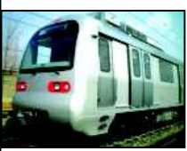
મેટ્રો ટ્રેન માટે વિશેષરૂપે બનાવાયેલી કંપની મેગાએ કામ આગળ વધાર્યું છે. અર્થનો રીપોર્ટ પણ તૈયાર કરી દેવાયો છે. મેટ્રો રેલને કાર્યરત કરવા લગભગ ૧૫,૦૦૦ કરોડનો ખર્ચ થાય તેમ છે. એકવાર પ્રોજેક્ટ શરૂ થાય તે પછી પણ તેના સંચાલનનો ખર્ચ ખુબ વધુ છે. કારણ કે મેટ્રો રેલના સંચાલનમાં ખુબ ઉર્જા વપરાશે. ગુજરાત જેવા રાજ્ય કે જ્યાં ઉર્જાનો ખર્ચ વધુ આવે છે ત્યાં મેટ્રો રેલના સંચાલનમાં અધિક ઉર્જા