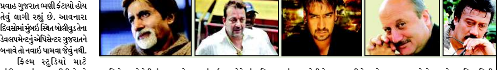
સ્ટુડિયો બનાવે તેવી સંભાવના છે. હિન્દી ફિલ્મ સ્ટાર્સ ઉપરાંત મુંબઈના ગોરેગાંવ વિસ્તારમાં જમીનના વિવાદમાં ઘેરાયેલા મોદીને પત્ર લખીને વડોદરા વિસ્તારમાં ૨૫ એકર જમીનની સ્થળોએ ૧૦ જેટલા ફિલ્મસિટી બની રહ્યાં છે. પ્રવાસન વિભાગના સુરોના જણાવ્યા પ્રમાણે દક્ષિણના કપરાડાને પૂના પાસેના ખંડલા અને લોનાવાલાની જેમ ડેવલપ કરવાનો ઈરાદો છે. રાજ્યના પ્રવાસન વિભાગે સ્પેશ્યલ ઈકોનોમિક ઝોનની જેમ હવે સ્પેશ્યલ એન્ટરટેઈનમેન્ટ ઝોન (એસીઈએનઝેડ) રચવાનો નિર્ણય કર્યો છે. આ વિભાગની મુદ્દાઓ

અમિતાભ બચ્ચન, સંજય દત્ત, અજય દેવગણ, અનુપમ ખેર, અક્ષય કુમાર, પરેશ રાવલ, સ્વ. દેવાનંદ, જેકી શ્રોફ, રવિના ટંડન, શરુખ સિંહ, વિનોદ ખન્ના, હેમા માલિની, ધર્મેન્દ્ર, પ્રિટી જિંટા, મુકેશ ખન્ના, મોડેલ સર્લિન ચોપરા, પ્રિયંકા ચોપરા