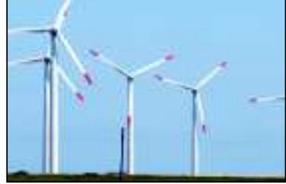
મેટ્રો ટ્રેન માટે વિશેષરૂપે બનાવાયેલી કંપની મેગાએ કામ આગળ વધાર્યું છે. અર્થનો રીપોર્ટ પણ તૈયાર કરી દેવાયો છે. મેટ્રો રેલને કાર્યરત કરવા લગભગ ૧૫,૦૦૦ કરોડનો ખર્ચ થાય તેમ છે. એકવાર પ્રોજેક્ટ શરૂ થાય તે પછી પણ તેના સંચાલનનો ખર્ચ ખુબ વધુ છે. કારણ કે મેટ્રો રેલના સંચાલનમાં ખુબ ઉર્જા વપરાશે. ગુજરાત જેવા રાજ્ય કે જ્યાં ઉર્જાનો ખર્ચ વધુ આવે છે ત્યાં મેટ્રો રેલના સંચાલનમાં અધિક ઉર્જા

પવનચક્કીઓ દ્વારા પેદા થતી વીજળી મેગા કંપની વેચશે અને અનુકૂળ હશે તો તે ઉર્જા મેટ્રો ટ્રેનના સંચાલનમાં વપરાશે