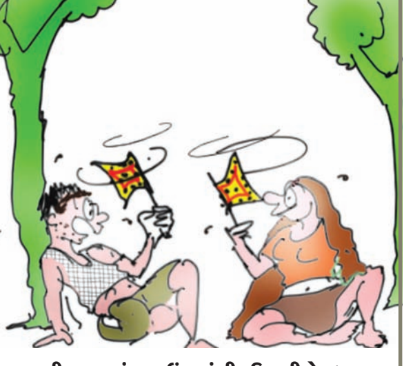
શીયાળામાં... ઉંઘમાંથી ઉઠાડીને ઘાબળા આપવાવાળા અત્યારે, કુલર એ.સી. મુકી જવાની જગ્યાએ... સ્લીપર આપીને જતા રહ્યા...!!

શહેરમાં મહારાણા પ્રતાપની જન્મજયંતિ ઉજવાશે