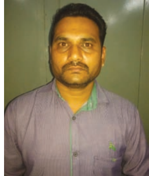
બોગસ ખેડૂત ઉભો કરી સે. ૧૬ની દેનાબેન્કમાં તથા કપડવંજની આઈસીઆઈસીઆઈ બેંકમાં બોગસ ખાતા ખોલાવી જમીન વેચી

ગાંધીનગર, તા. ૫ પેથાપુરના એક વૃદ્ધની પેથાપુર ગામની સીમમાં આવેલી કરોડોની કિંમતની જમીન બારોબાર વેચી દીધાનો કિસ્સો બનવા પામ્યો હતો. પંચાયતના બોગસ સિક્કાથી લઈ બોગસ ખેડૂત ઉભો કરીને બેંકમાં ખાતુ ખોલાવી દેવાયું હતું. પરંતુ બોગસ ખેડૂતને બદલે સાચા ખેડૂતને ઘરે બેંકનું એટીએમ આવતા સમગ્ર મામલો બહાર આવ્યો હતો. એલસીબીએ આ ગુનામાં મુખ્ય સૂત્રધાર આરોપીને પકડી પાડી સઘન પુછપરછ શરૂ કરી છે.