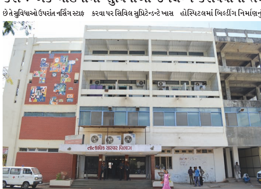
માટે અલાયદી બેઠક વ્યવસ્થા, રેમો રૂમમાં ખુટતી સુવિધાઓ પણ ઉભી કરવા પર સિવિલ સુપ્રિટેન્ડેન્ટે ખાસ હોસ્પિટલમાં બિલ્ડીંગ નિર્માણનું અભાવ જોવા મળી રહ્યો છે. સિફ્ટની વ્યવસ્થા સામે પણ ગંભીર ફરિયાદો રહેવા પામી છે. આવી સ્થિતિમાં ગાંધીનગર સિવિલ હોસ્પિટલમાં સેવાઓ વિવાદાસ્પદ બની રહી છે. ગાંધીનગર સિવિલ હોસ્પિટલને કોર્પોરેટ લુક આગામી દિવસોમાં આપવા માટેનું આયોજન તૈયાર થઈ ગયું છે અને તે સંદર્ભે જ હોસ્પિટલની માળખાકીય સુવિધાઓને લઈ આજે સિવિલ સુપ્રિટેન્ડેન્ટ અને પીઆઈયુના ઉચ્ચ અધિકારીઓનો રાઉન્ડ યોજાયો હતો. મળતી વિગતો મુજબ આગામી એક માસમાં ખુટતી સુવિધાઓ ઉપલબ્ધ કરી દેવાશે તેવી ખાત્રી પીઆઈયુ તરફથી આપવામાં આવી છે.

ગાંધીનગર, તા. ૧૩ ગાંધીનગર સિવિલ હોસ્પિટલના આધુનિકરણને વેગ આપવાના હેતુસર આજે સિવિલ સુપ્રિટેન્ડેન્ટ અને પી.આઈ.યુ.ના સત્તાવાળાઓ તેમજ આરએમઓ સહિતના અધિકારીઓએ સિવિલ હોસ્પિટલનો રાઉન્ડ લીધો હતો. બે કલાક સુધી ચાલેલા આ રાઉન્ડમાં પિડિયાટ્રીક વોર્ડમાં વેન્ડીલેશનની સુવિધા, પાણીના નિકાલની યોગ્ય વ્યવસ્થામાં રહેલી તુટીઓ, દિવાલો પર આવતા ભેજ તેમજ પુરતા ફોર્સથી પાણી પુરવઠો નહિ મળતા હોવાની ફરિયાદો તાકીદે દૂર કરવા કડક તાકીદ કરવામાં આવી હતી.