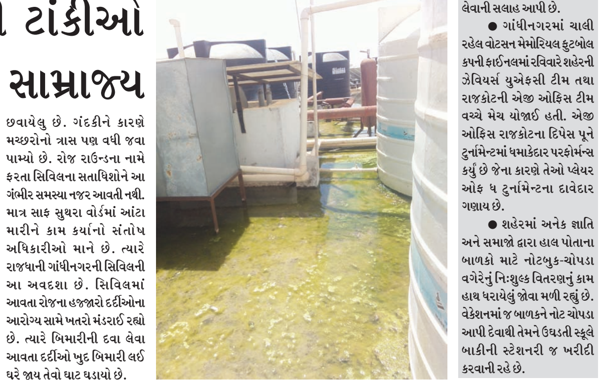
સિવિલમાં ઈન્ડોર દર્દીઓના આરોગ્ય માથે ખતરો ઝંબુભી રહ્યો છે. પાણીજન્ય રોગચાળાને પગલે દર્દીઓ જ્યાં સારવાર માટે આવતા હોય છે ત્યાં જ મોટી બિમારીના એંધાણ વર્તાઈ રહ્યા છે.

હવાયેલુ છે. ગંદકીને કારણે મચ્છરોનો ત્રાસ પણ વધી જવા પામ્યો છે. રોજ રાઉન્ડના નામે ફરતા સિવિલના સત્તાધિશોને આ ગંભીર સમસ્યા નજર આવતી નથી. માત્ર સાફ સુથરા વોર્ડમાં આંટા મારીને કામ કર્યાનો સંતોષ અધિકારીઓ માને છે. ત્યારે રાજધાની ગાંધીનગરની સિવિલની આ અવદશા છે. સિવિલમાં આવતા રોજના હજારો દર્દીઓના આરોગ્ય સામે ખતરો મંડરાઈ રહ્યો છે. ત્યારે બિમારીની દવા લેવા આવતા દર્દીઓ ખુદ બિમારી લઈ ઘરે જાય તેવો ઘાટ ઘડાયો છે.