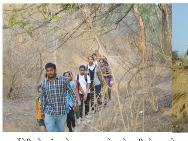
દર વર્ષે ટ્રેકીંગ કેમ્પનું આયોજન થાય છે. આગામી સપ્તાહથી વધુ એક સાથે સાથે વાલીઓ પણ પોતાના કરવાથી બાળકનું શરીર ખડતલ બને છે તેમજ બાળકોમાં આત્મવિશ્વાસ પરિસ્થિતિનો સામનો કરવા સજજ બને છે. ગાંધીનગરમાં પુનિતવન,