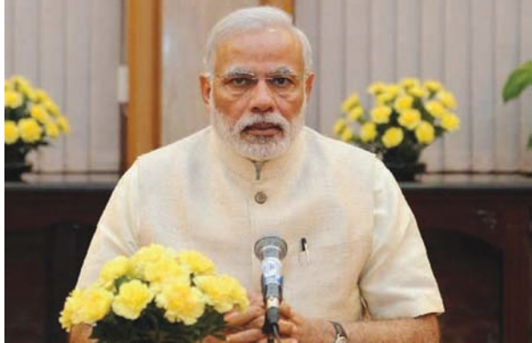
મન કી બાત કાર્યક્રમમાં અનેક મુદ્દા ઉપર ચર્ચા : ઈપીઆઈ એટલે એવરી પર્સન ઇમ્પોર્ટન્ટ : સબકા સાથ સબકા વિકાસનો ઉદ્દેશ્ય પડોશી દેશો માટે પણ છે : મોદી

નવીદિલ્હી, તા. ૩૦ વડાપ્રધાન નરેન્દ્ર મોદીએ મન કી બાત કાર્યક્રમમાં જુદા જુદા વિષય ઉપર વિસ્તારપૂર્વક વાત કરી હતી. મન કી બાત કાર્યક્રમના ૩૧માં એપિસોડમાં મોદીએ યુવાનો, વિદ્યાર્થીઓ સાથે પણ વાત કરી હતી. આ કાર્યક્રમ પીએમઓના યુટ્યુબ ચેનલ, માહિતી અને પ્રસારણ મંત્રાલય અને ડીડી ન્યુઝ ઉપર પણ દર્શાવવામાં આવતા લોકોએ વધુ સાંભળવાની તક ઝડપી હતી. મોદીએ કહ્યું હતું કે, સબકા સાથ સબકા વિકાસનો હેતુ માત્ર ભારતના લોકો માટે જ નહીં બલકે પડોશી દેશો માટે પણ છે. મોદીએ પોતાના વિદેશ પ્રવાસ, જુદા જુદા મહાનુભાવોની જન્મજયંતિ, વીઆઈપી કલ્ચર, ભીમ એન્ડ, નવી ડિજિટલ ક્રાંતિ, વેકેશનના ગાળા દરમિયાન પ્રવાસના સંદર્ભમાં વિસ્તારપૂર્વક વાત કરી હતી. મોદીએ કહ્યું હતું કે, વીઆઈપી કલ્ચરને ખતમ કરવામાં આવ્યા બાદ તમામ વર્ગ તરફથી લોકો અભિનંદન આપી રહ્યા છે પરંતુ લાલભત્તીની વીઆઈપી પરંપરા હાલમાં સંપૂર્ણપણે