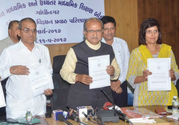
ગુજકેટની ગઈકાલે લેવાયેલ પરીક્ષામાં ગેરરીતીનો એક પણ કિસ્સો નોંધાયેલો નથી. પરીક્ષાઓના પરિણામો બાદ વિદ્યાર્થીઓ દ્વારા કોઈ અઘટીત

વાલીઓએ આ બાબતને ઘટનાઓ ન બને તે માટે શિક્ષણ સહજતાથી સ્વીકારી લીધી છે. વિભાગે છેલ્લા બે વર્ષથી સુયોજીત