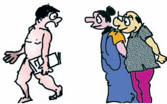
ચિંતા ન કરો... નીટની પરીક્ષામાં ટાઈમ ન બગડે તેના માટે કપડા પહેચા વગર જઈ છું...!!