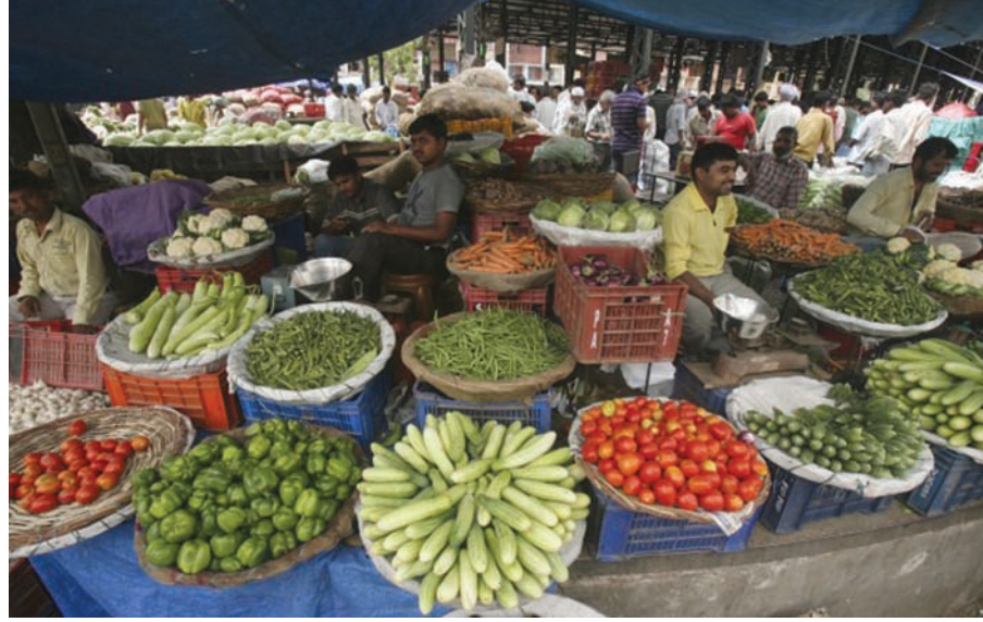
શાકમાર્કેટમાં ભાવ વધારાને પગલે વેચાણમાં પણ નોંધપાત્ર ઘટાડો ચલવપહલ ઓછી થઈ ગઈ છે. શાકના ભાવ આસમાને આંબતા

હતા. પરંતુ ઓછા વાવેતર તેમજ ગરમીને પગલે શાકબજારમાં ઓછું આવતા દરેક શાકમાં ભાવ વધારો છે તેમ વેપારીઓ જણાવી રહ્યા રહ્યા છે. કેરી કિલોના ૪૦ થી ૬૦ છે ત્યારે બજારમાં શાકના ભાવ કિલોના રૂ. ૬૦ થી ૮૦ નો છે. બજારમાં શાકના ભાવમાં ભડકો