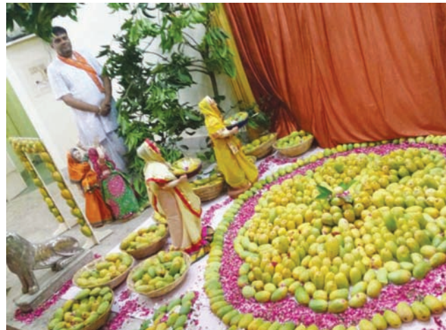
પ્રભુને ઋતુ અનુસાર ભોગ ધરાવવાની પરંપરા પુષ્ટિ સંપ્રદાયમાં સૈકાઓથી ચાલી આવે છે. તેના ભાગ રૂપે શ્રી ગોવર્ધનનાથજીની હવેલી, સેક્ટર-૨૧, ગાંધીનગર ખાતે કેરીના મનોરથનું આયોજન કરાયું હતું. જેમાં લગભગ ૫૦૦થી પણ વધુ કેરીઓ અને ઠાકોરજીના દર્શન કરવા વૈષ્ણવો મોટી સંખ્યામાં ઉમટી પડ્યા હતા.