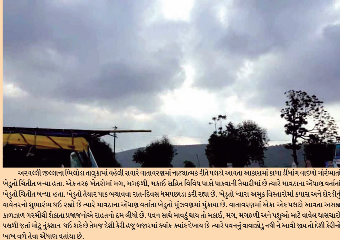
અરવલ્લી જિલ્લાના ભિલોડા તાલુકામાં વહેલી સવારે વાતાવરણમાં નાટ્યાત્મક રીતે પલટો આવતા આકાશમાં કાળા ડીબાંગ વાદળો ગોરંભાતાં ખેડુતો ચિંતિત બન્યા હતા.

૧૩ જેટલા યાત્રિકોને પાલનપુર સિવિલમાં ખસેડાયા નેપાળથી પરત ફરતા ભુજના યાત્રાળુ ઓને ફૂડ પોઈઝન થતા અફરા તફરી મચી ગઈ હતી. દરમિયાન અસરગ્રસ્ત ૧૩ થી વધુ યાત્રિકોને સારવાર અર્થે પાલનપુર સિવિલ હોસ્પિટલમાં ખસેડાયા હતા.