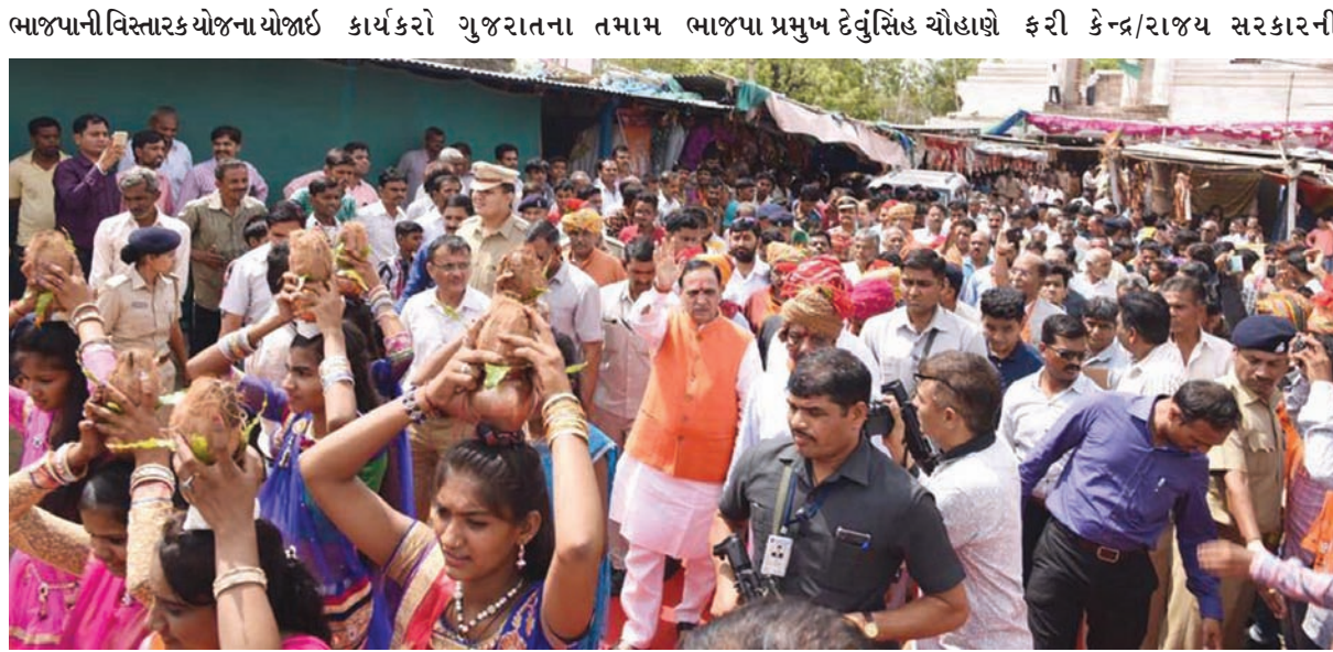
ભાજપાની વિસ્તારક યોજના યોજાઈ રહી છે. એવી જાણકારી આપતાં મુખ્યમંત્રીએ જણાવ્યું કે નવ દિવસ ચાલનાર આ કાર્યક્રમમાં ૪૮૦૦૦ બુથમાં ઘેરઘેર જઈને લોકસંપર્ક કરશે. સાંસદ અને ખેડા જિલ્લા

નડીઆદ, તા. ૨૮ મુખ્યમંત્રી વિજયભાઈ રૂપાણીએ આગામી વિધાનસભાની ચૂંટણીઓમાં ભાજપા ૧૫૦થી વધુ બેઠકો મેળવશે એવો નિર્ધાર વ્યક્ત કર્યો છે. કોંગ્રેસને આડે હાથે લેતાં મુખ્યમંત્રીએ જણાવ્યું કે કોંગ્રેસ માટે સત્તા હજારો ગાઉ દૂર છે. હાલમાં કોંગ્રેસ પોતાનું અસ્તિત્વ ટકાવવા માટે ફાફાં મારી રહી છે. ભૂતકાળમાં કેન્દ્રમાં કોંગ્રેસના શાસનમાં દર માસે એક નવું કોભાંડ થતું હતું. દેશમાં વડાપ્રધાન નરેન્દ્રભાઈ મોદીના સક્ષમ નેતૃત્વમાં પ્રમાણિક અને ઈમાનદારીના શાસનની પ્રજાને સાથે જ અનુભૂતિ થઈ રહી છે. તેમ તેમણે ઉમેર્યું હતું. મુખ્યમંત્રી વિજયભાઈ રૂપાણીએ આજે ખેડા જિલ્લામાં