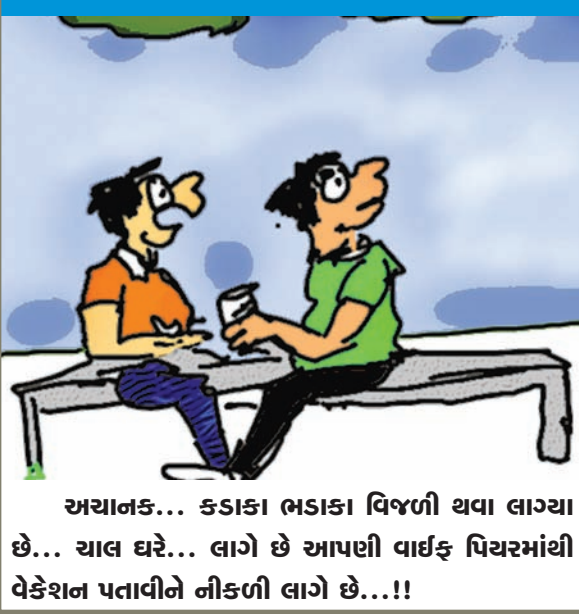
અચાનક... કડાકા ભડાકા વિજળી થવા લાગ્યા છે... ચાલ ઘરે... લાગે છે આપણી વાઈફ પિચરમાંથી વેકેશન પતાવીને નીકળી લાગે છે....!!