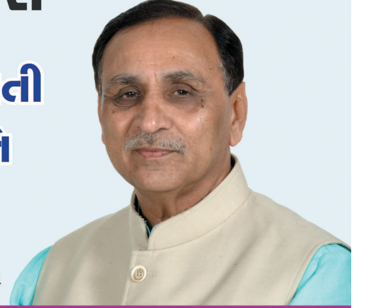
શ્રી વિજયભાઈ રૂપાણી મુખ્યમંત્રી, ગુજરાત