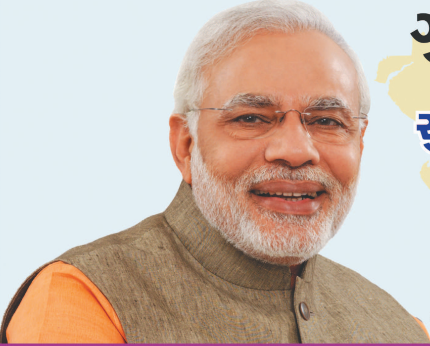
શ્રી નરેન્દ્રભાઈ મોદી વડાપ્રધાન, ભારત

સુખ, સમૃદ્ધિ અને સલામતી ગુજરાતની એ જ પ્રગતિ