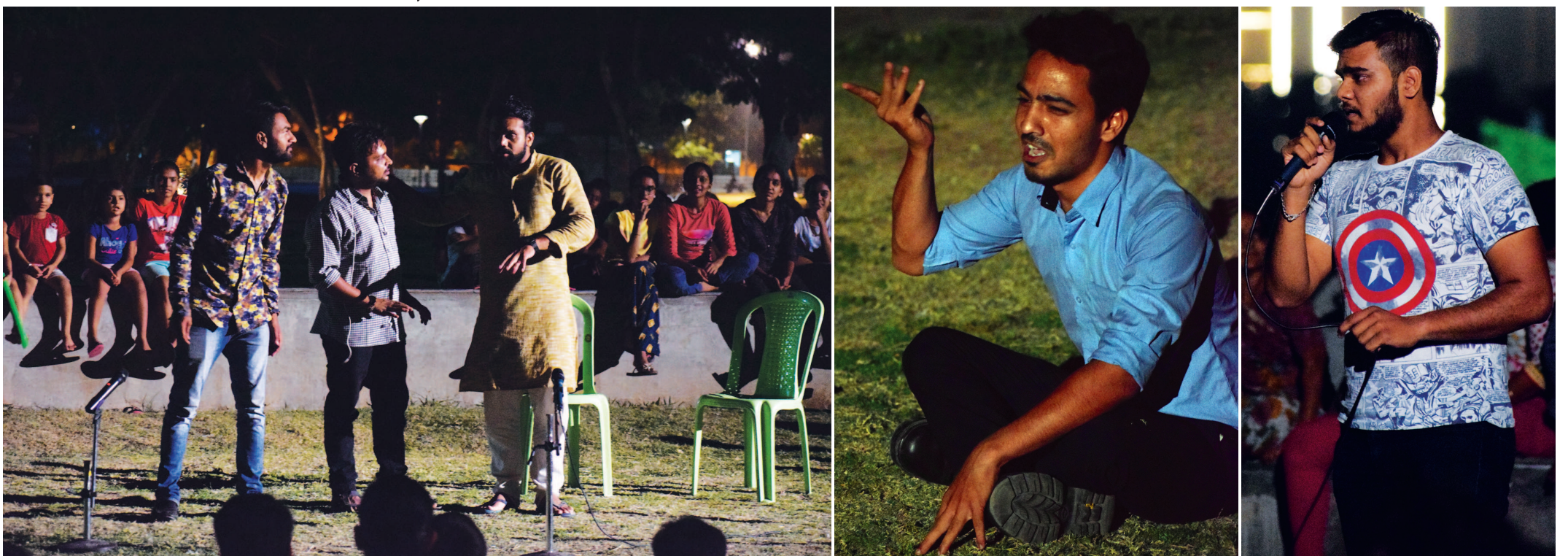
ગિયા હોદ્દા પર બેઠેલા લાયકાત વગરના માણસો સમાજને કેટલું નુકસાન કરે છે, લોકોના જીવને કેટલા જોખમમાં મૂકે છે અને પોતે જે સ્થાન પર બેઠા છે તે સ્થાનનું નામ પણ કેટલું ખરાબ કરે છે તે અંગે પ્રકાશ પાડતું સુંદર મજનું નાટક સ્વલ્પિમ પાર્ક ખાતે પ્લેગ ઈન્સ એન્ટરટેઈનમેન્ટ આયોજિત 'સેટરડે નાઈટ્સ' અંતર્ગત ભજવવામાં આવ્યું હતું. 'સેટરડે નાઈટ્સ'ની સિઝન-૪ના બીજા એપિસોડમાં દિવ્યાનંત વર્માના નિર્દેશનમાં આ નાટક ઉપરાંત ગીત-સંગીતની સુંદર મહેફિલ પણ જમાવવામાં આવી હતી, જેમાં નગરના નામી-અનામી અનેક કલાકારોએ ભાગ લીધો હતો. શનિવારે રાત્રે મોટી સંખ્યામાં કલાના રસિકોએ શાંતિપૂર્વક આ કાર્યક્રમને માણ્યો અને વખાણ્યો હતો.