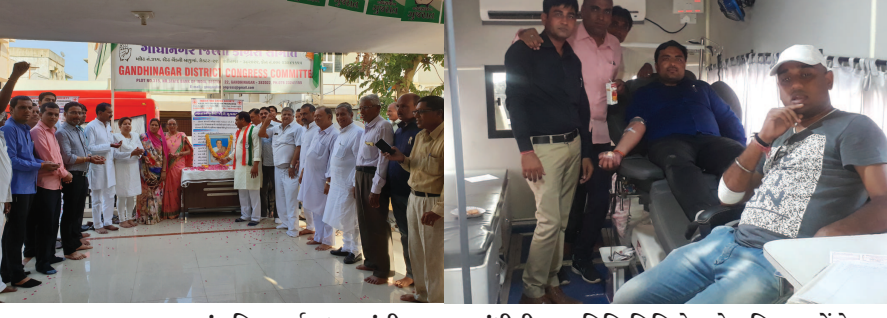
રક્તદાન દ્વારા શ્રદ્ધાંજલિ - પૂર્વ પ્રધાનમંત્રી રાજીવ ગાંધીની પુણ્યતિથિ નિમિત્તે શહેર-જિલ્લા કોંગ્રેસના કાર્યકરો દ્વારા રક્તદાન કેમ્પ યોજાયો હતો... કાર્યક્રમના પ્રારંભે અગ્રણીઓએ પુષ્પાંજલિ આપી હતી....