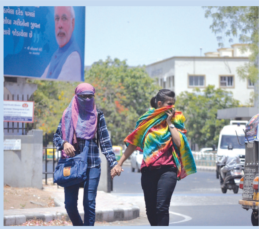
કાળજાળ ગરમી - ૧૫-૧૫ દિવસથી થતી અગનવર્ષા હજુ ચંબવાનું નામ નથી લેતી... ૪૧-૪૨થી ઉપરની ડિગ્રીવાળા તાપમાનમાં બહાર નિકળવું અઘરું બની જાય છે... દેહ દગડાટી ગરમીથી બચવા દુપટ્ટો, ટોપી, મોજા, રૂમાલ અને ગોગલ્સનો સહારો લેવો પડે છે... શહેરમાં આવા દેશો ઠેર-ઠેર જોવા મળે છે... શાળા-કોલેજમાં અભ્યાસ માટે વિદ્યાર્થીઓને તો નાશ્ટરકે આકરા તાપમાં બહાર નિકળવું પડતું હોય છે... એટલે ગરમીથી બચવા આવા હાથવગા ઉપાયો અજમાવી લેવા વિદ્યાર્થીઓ ઘર કે શાળા ભણી જતા જોવા મળે છે....