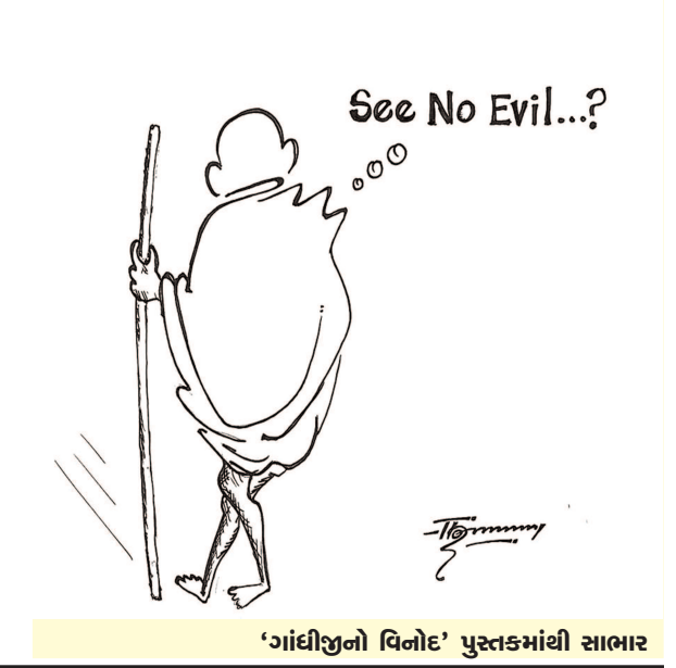
'ગાંધીજીનો વિનોદ' પુસ્તકમાંથી સાભાર