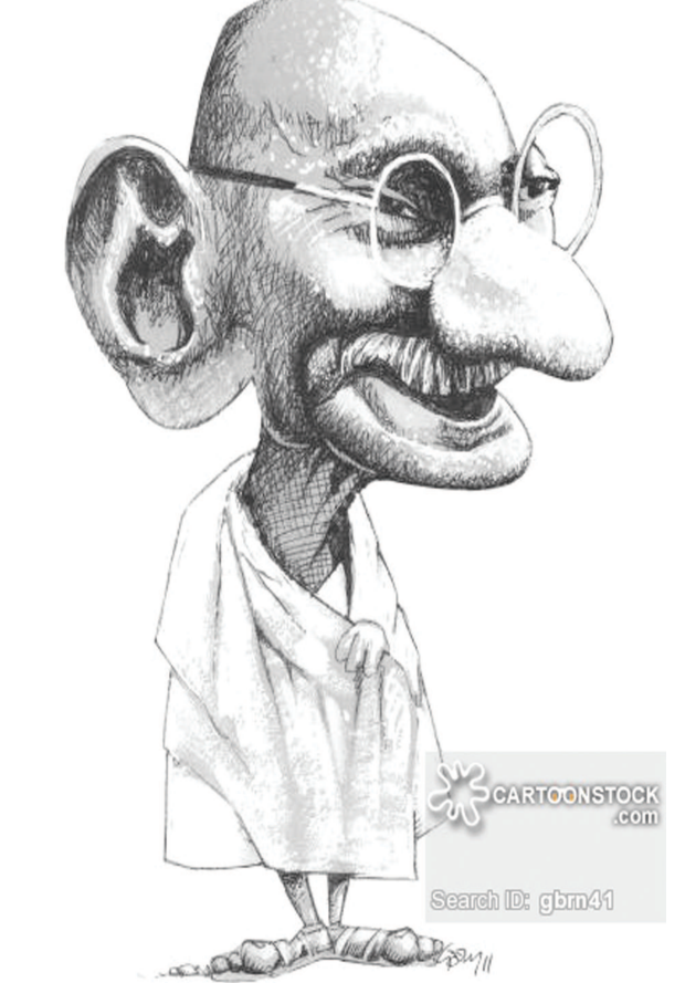
'ગાંધીજીનો વિનોદ' પુસ્તકમાંથી સાભાર