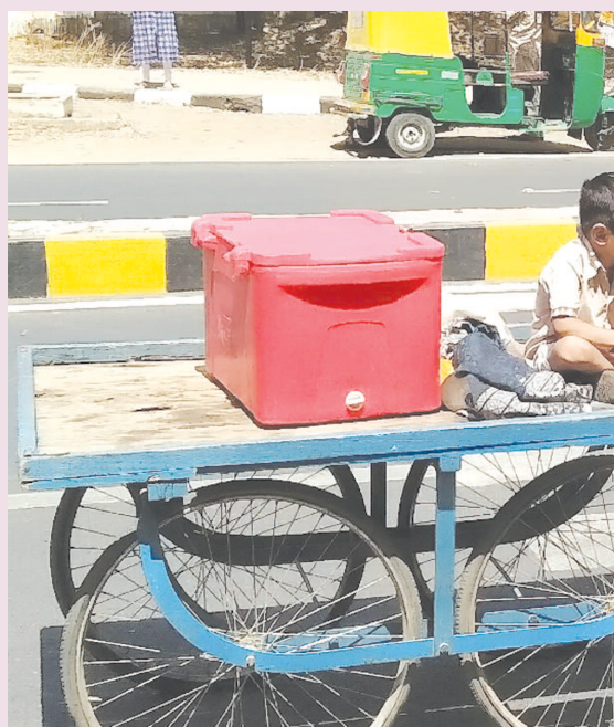
વિચિત્ર વિરોધાભાસ - ઠંડા પાણીના પાઉચ વેચીને ગુજરાન ચલાવતી શ્રમિક મહિલા કેવી ગરમી સહન કરે છે... ધોમધમતા તાપમાં પોતાના વડાલસોયા સંતાનને ડર ડિડી તાપમાનમાં પણ લાડી પર ખુલ્લામાં બેસાડી ઠંડા પાણીના પાઉચની પેટી લઈ ભરા બપોરે ગંતવ્ય સુધી પહોંચવા અને પેટિયું રળવા આ મહિલા આકરી ગરમીમાં પણ ઠંડક વેચવા નીકળી છે... છે ને વિચિત્ર વિરોધાભાસ...

ગાંધીનગર, તા. ૧૬ ગાંધીનગર મેડીકલ કોલેજમાં પી.જી. અભ્યાસક્રમ ચાલુ કરવાની મંજૂરી આ વર્ષે પણ માંગવામાં આવી છે. મળતી વિગતો પ્રમાણે માઈક્રોબાયોલોજી, પેથોલોજી, ઈ.એન.ટી., એનેસથેસિયા, ઓર્થોલોજી જેવી શાળાઓનો પણ સમાવેશ થાય છે. કોલેજ ખાતે ડી.એમ.જી.ના ચાર જેટલા અભ્યાસક્રમો ચાલી રહ્યા છે તેમાં ટ જેટલી વિવિધ શાળાઓના અભ્યાસક્રમની મંજૂરી માંગવામાં આવી છે. મળતી વિગતો પ્રમાણે માઈક્રોબાયોલોજી, પેથોલોજી, ઈ.એન.ટી., એનેસથેસિયા, ઓર્થોલોજી જેવી શાળાઓનો પણ સમાવેશ થાય છે. કોલેજ ખાતે ડી.એમ.જી.ના ચાર જેટલા અભ્યાસક્રમો ચાલી રહ્યા છે તેમાંથી ત્રણ જેટલા વિભાગોમાં ઉચ્ચ અભ્યાસક્રમ માટેની મંજૂરી માંગણે તેવો વિશ્વાસ છે. કોલેજના સૂત્રોમાંથી પ્રાપ્ત થતી વિગતો પ્રમાણે નવા પી.જી.ના અભ્યાસક્રમો શરૂ થાય તે માટેની તૈયારીઓ આરંભી દેવામાં આવી છે અને કાઉન્સિલના ઈન્સપેક્શન પહેલાં તે પૂર્ણ કરી દેવામાં આવશે.