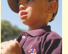
જીલ્લા મેહુલકુમાર મહિયાર