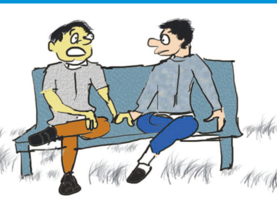
લાગે છે કે અચ્છે દીન ફરીથી આવે છે...!!