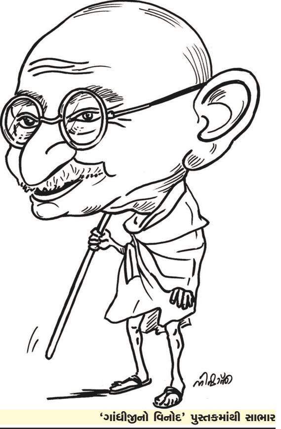
‘ગાંધીજીનો વિનોદ’ પુસ્તકમાંથી સાભાર

કરતા વધારે સાઠ્ઠ આવવા છતાં ધોરણ દસની પરીક્ષામાં છોકરીઓનું પ્રમાણ ખુબ ઓછું છે. સરેરાશ ૩૭ ટકા છોકરીઓ ધોરણ દસની પરીક્ષા આપે છે.