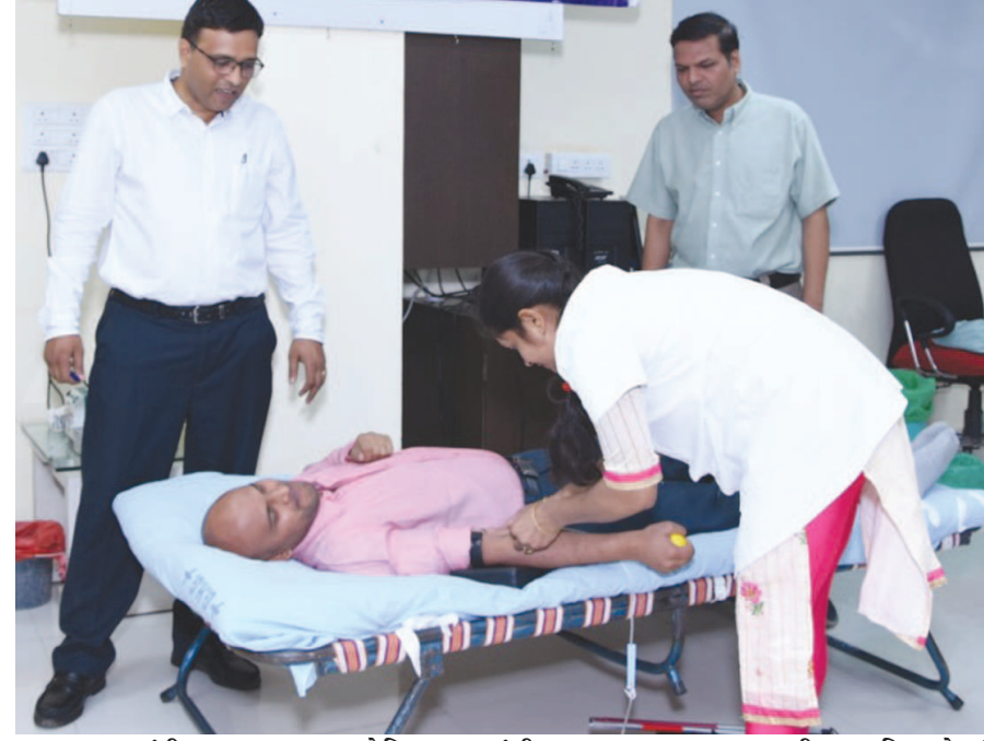
ગાંધીનગર, તા. ૨૪ સ્ટેટ બેન્ક જ્ઞાનાર્જન અને વિકાસ સંસ્થા, (ટ્રેનિંગ સેન્ટર), ગાંધીનગર દ્વારા શુક્રવારે સિવિલ હોસ્પિટલ, ગાંધીનગર ખૂબ લોહીની માંગનું પ્રમાણ ખૂબ ઊંચું હોય છે અને દર્દીની સારવાર માટે ઘણીવાર રક્તની

તાતી જરૂરિયાત ઊભી થતી હોય છે આ વાતનું ધ્યાન રાખીને બેન્ક દ્વારા એક ઉમદા પ્રયાસ કરવામાં આવ્યો હતો. સ્ટેટ બેન્ક જ્ઞાનાર્જન અને વિકાસ સંસ્થા દ્વારા વારંવાર આ પ્રકારના કાર્યક્રમ દ્વારા જનકલ્યાણના ઉમદા કામમાં અમુલ્ય ફાળો આપવામાં આવે છે.