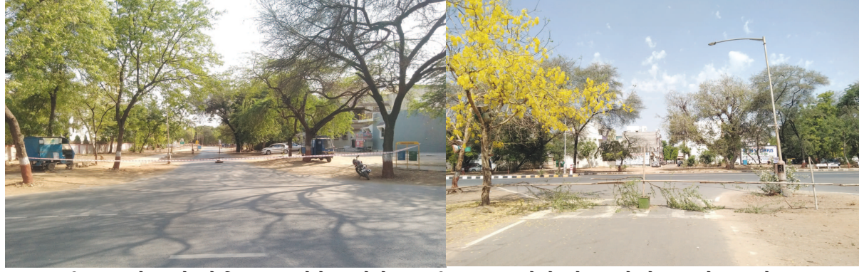
ગાંધીનગરમાં છેલ્લા એક બે દિવસમાં જ કોરોનાના કેસોમાં ઝડપી ઉછાળા આવ્યો છે. મોટા ભાગે લોકડાઉનનો યુક્તપણે અમલ કરતા ગાંધીનગર શહેરના વસાહતીઓ હવે વધુ સજાગ બની ગયા છે. સેક્ટર-૬ના રહેવાસીઓ હવે વધુ સજાગ બની લોકડાઉનનું જડબેસલાક રીતે પાલન કરાવી રહ્યા છે. યુવાનોને સેક્ટરના નાકે બેસાડી અવરજવરને પ્રતિબંધિત કરવામાં આવી છે.