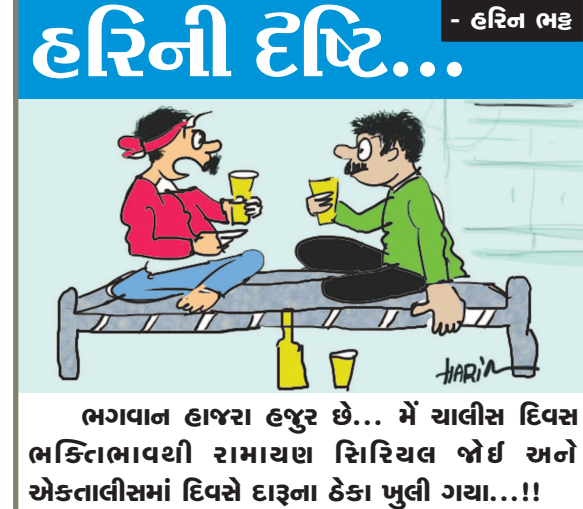
હરિની દષ્ટિ... ભગવાન હાજરા હજુર છે... મેં ચાલીસ દિવસ ભકિતાભાવથી રામાચલ સિરિચલ જોઈ અને એકતાલીસમાં દિવસે દારૂના ઠેકા ખુલી ગયા...!!

જનજીવનમાં અનોખા સમ્રાટ સાથે માયુસી જોવા મળી રહી છે. બપોરના સમયે તો શહેરમાં જાણે કોઈ રહેતુ જ ન હોય તેવા દ્રશ્યો જોવા મળે છે. આકરી ગરમીથી બચવા માટે લોકડાઉનનો અમલ કરતા નગરજનો ઘરમાં એ સી, કુલરની હવા ખાઈને દિવસે પસાર કરી રહ્યા છે. જ્યારે કેટલાક કેકાણે ગરમીથી રક્ષણ મેળવવા કોઈ ઉપકરણો ન હોવાથી હીટવેવની અસરથી ઘરમાં બેઠેલા નાગરિકો પણ મુંઝવણ અનુભવી રહ્યા છે. લઘુત્તમ તાપમાન પણ ૨૯ ડિગ્રીની નજીક હોવાથી રાત્રિના સમયે પણ ગરમીનુ જોર યથાવત રહે છે. ગઈકાલની સાપેક્ષમાં આજે ગરમીનો પારો એક ડિગ્રી ઉપર આવતા સિઝનની રેકર્ડ બ્રેક ગરમીથી જનજીવન તોખા પોકારી ગયુ હતુ.