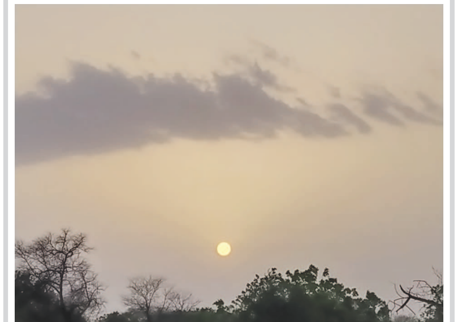
આજે સવારે વાતાવરણમાં એકાએક પલટો આવ્યો હોય તેવું લાગતું હતું... આકાશમાં વાદળો, અતિશય ઉકળાટ... નગરજનોને ચોમાસું નજીક છે એવો આભાસ થતો હતો...

મહેસાણા, તા. ૩૦ વિશ્વ જયારે કોરોના મહામારીથી સંક્રમિત છે ત્યાં ભારત સરકાર દ્વારા પણ દેશમાં કોરોના સક્રમણ ઓછું થાય તે પગલે ઠેર ઠેર સલામતી અને સાવચેતીના પગલાં લઈ પ્રજાજનોને સુરક્ષિત રાખવાના પ્રયાસ કરવામાં આવી રહ્યાં છે