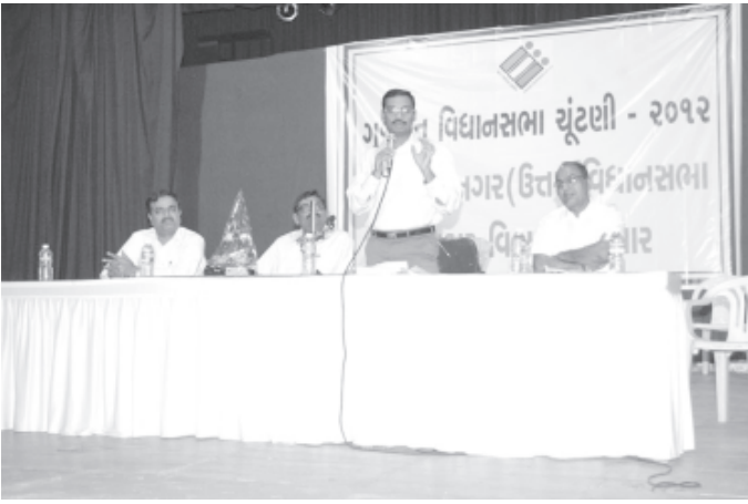
ગાંધીનગર ઉત્તર વિધાનસભા મતવિસ્તારના અધિકારીઓ અને કર્મચારીઓ માટે ચૂંટણીલક્ષી તાલીમ કાર્યક્રમ ગાંધીનગર ટાઉનહોલ ખાતે યોજાયું હતો.