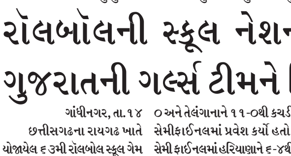
રોલબોલની સ્કૂલ ગેમ નેશનલ ચેમ્પિયનશીપ તા. ૮મી થી ૧૨મી નવેમ્બર દરમિયાન છત્તીસગઢના રાયગઢ ખાતે યોજાઈ હતી. જેમાં ગુજરાતની ગર્લ્સ અને બોયલ બંને વિભાગની અન્ડર-૧૪ ટીમોએ ભાગ લીધો હતો. ગર્લ્સ ટીમે આ સ્પર્ધામાં ઉત્કૃષ્ટ દેખાવ કરતા અરબંડને ૫-૪, છત્તીસગઢને ૬-૩, પંજાબને ૧૧-૦ અને તેલંગાનાને ૧૧-૦થી કચડી સેમીફાઈનલમાં પ્રવેશ કર્યો હતો. સેમી ફાઈનલમાં હરિયાણાને ૬-૪થી