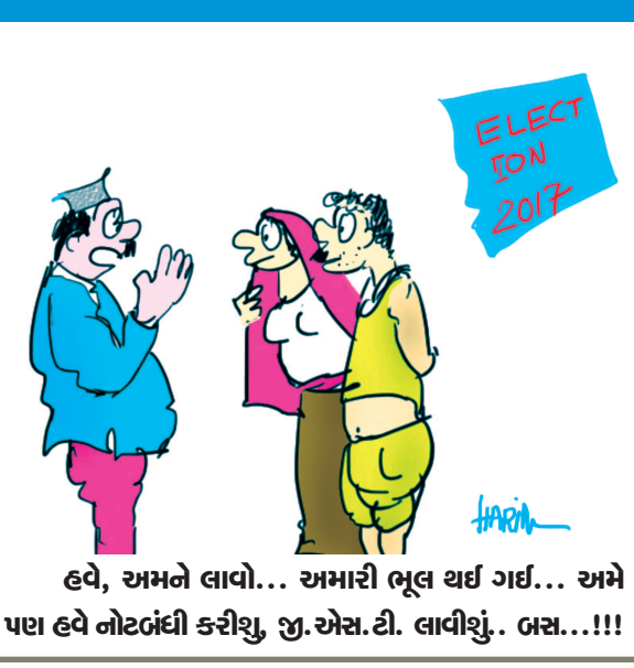
હવે, અમને લાવો... અમારી ભૂલ થઈ ગઈ... અમે પણ હવે નોટબંધી કરીશું, જી.એસ.ટી. લાવીશું.. બસ...!!!!