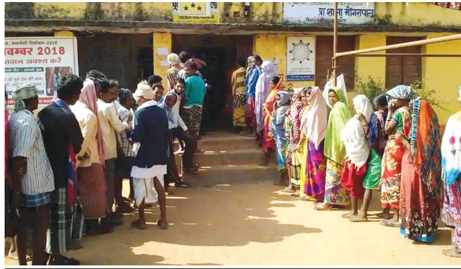
ચત્તીસગઢમાં અભૂતપૂર્વ સુરક્ષા અને હિંસા વચ્ચે આજે ઉંચું મતદાન થયું હતું. પ્રથમ તબક્કામાં ૭૦ ટકાથી વધુ મતદાન થતાં ભાજપ અને કોંગ્રેસમાં ભારે સંયોજનની સ્થિતિ રહી હતી. બંને પાર્ટીઓએ જીત માટેના દાવા કર્યા હતા. પ્રથમ તબક્કામાં ૭૦ ટકા મતદાન વચ્ચે જુદા જુદા વિસ્તારોમાં પણ ઉંચું મતદાન થયું હતું. પ્રથમ તબક્કામાં મતદાનની સાથે જ મુખ્યમંત્રી રમણસિંહ સહિત ૧૮૦ ઉમેદવારોના ભાવિ ઈવીએમમાં સીલ થઈ ગયા હતા. ૧૦ વિધાનસભા બેઠાઓમાં સવારે

હિંસાના છુટાછવાયા બનાવો વચ્ચે નોંધનીય મતદાન નોંધાયું : નક્સલવાદીગ્રસ્ત વિસ્તારોમાં મતદાન કરવા લોકો ઉત્સાહ અને હિંમતપૂર્વક બહાર નિકળતા તંત્ર ખુશખુશાલ : ઉંચા મતદાનથી ભાજપ-કોંગ્રેસ ઉત્સાહિત