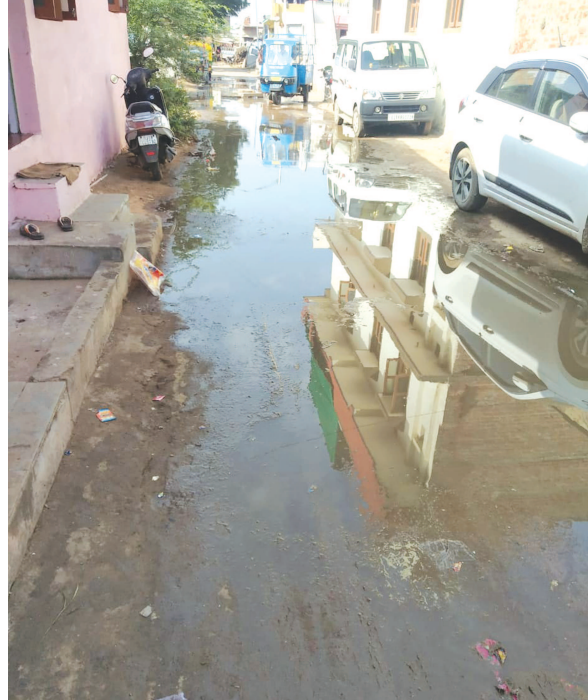
શહેરના સેક્ટરોમાં ગટરો ઉભરાવાની સમસ્યા જટીલ બની છે. સેક્ટરોમાં દાયકાઓ જુની ગટર લાઈનની ચેમ્બર તુટતા વારંવાર ગટરોનું દૂષિત પાણી રહીશોના ઘર આંગણે ફરી વળે છે. ગટરોના દૂષિત પાણીના ભરાવાના લીધે મચ્છરો અને જીવાતનો ઉપદ્રવ થતો હોવાથી રોગચાળાને પણ બળ મળતું હોવાના આકોશ સાથે તંત્ર દ્વારા ગટરો ઉભરાવાની ફરિયાદોનો ઝડપથી નિકાલ કરવામાં આવે તેવો પણ સુર ઉઠવા

હેલ્લા ઘણાં સમયથી ગટરો ઉભરાવાની સમસ્યાનો અનેક રજૂઆતના અંતે અંત આવતો નથી ગાંધીનગર તા. ૪ ગોકુળપુરામાં છેલ્લા ઘણાં સમયથી ગટરોનું દૂષિત પાણી ફરી વળ્યું છે. આ વિસ્તારમાં રસ્તાઓ પર ગટરના દૂષિત પાણીનો ભરાવો થતા અસહ્ય ગંદકી વચ્ચે રોગચાળાની દહેશત પ્રબળ બની છે. સ્થાનિકો દ્વારા આ અંગે તંત્ર સમક્ષ રજૂઆત કરવા છતાં સમસ્યાનો કાયમી નિકાલ થાય તેવા કોઈ પગલા લેવાતા નહોવાનો રોષ પ્રવર્ત્યો છે.