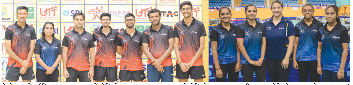
ફેડરેશન ઓફ ઈન્ડિયાના આશ્રય હેઠળ ગુજરાત સ્ટેટ ટેબલ ટેનિસ

ગાંધીનગર, તા. ૮ ગુજરાતની વિમેન્સ ટીમ જે કરી શકી નહીં તે મેન્સ ટીમે કરી દેખાડ્યું કેમ કે ગુજરાતની મેન્સ ટીમે ગુરુવારથી ભાવનગર ખાતે શરૂ થયેલી યુટીટી નેશનલ રેન્કિંગ (સેન્ટ્રલ ઝોન) ટેબલ ટેનિસ ચેમ્પિયનશિપની ફાઈનલમાં પ્રવેશ કરી લીધો હતો. એસએલ સ્પોર્ટ્સ કોમ્પ્લેક્સ ખાતે ટુર્નામેન્ટનો પ્રારંભ થયો હતો. ટેબલ ટેનિસ