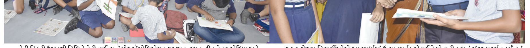
નેવી વિકની ઉજવણી નિમિત્તે નેવી વાઈસ વેન્કેર એસોસિએશન ગુજરાત, દમન, દીવ નેવલ એરિયા અને નેવી ચિલ્ડ્રન સ્કૂલ, ભારબંદર દ્વારા સ્કૂલના વિદ્યાર્થીઓ માટે ડ્રોઈંગ અને પેઈન્ટિંગ કોમ્પિટિશનનું આયોજન કરવામાં આવ્યું હતું. ભાવિ પેઢીમાં નેવી અંગે જાગૃત્તા લાવવાના હેતુસર આ સ્પર્ધા યોજવામાં આવી હતી.

અને તેના પરિણામે તેમના પરિવારો મુશ્કેલીમાં આવી શકે છે. તાલીમ દરમિયાન માછીમારોને ડિસ્ટ્રેસ એલર્ટ ટ્રાન્સમિટરના ઉપયોગ અને સૌથી નજીકના ICG એકમ ખાતે બિનઈરાદાપૂર્વક એકિટવેશનની જાણ કરવાનું બતાવવામાં આવ્યું હતું. માછીમારો ભારતની દરિયાઈ સીમામાં સુરક્ષા એજન્સીઓની આંખો અને કાન છે અને કોઈપણ શંકાસ્પદ ગતિવિધીની જાણ કરવામાં તેઓ મહત્વની ભૂમિકા ભજવે છે. માછીમારોને વિનંતી કરવામાં આવી હતી કે તેમને દરિયાઈ સીમામાં કોઈપણ શંકાસ્પદ ગતિવિધી જોવા મળે તે વિશે ચેનલ ૧૬ અને રિપોર્ટિંગ સાઈટ પર ભારતીય કોસ્ટ ગાર્ડને કોલ કરીને તેની જાણ કરે. માછીમારોને જરૂરી લોજિસ્ટિક સહાય આપવામાં આવી હતી અને તેમના તબીબી સ્વાસ્થ્યનું ચેકઅપ કરવામાં આવ્યું હતું. દરિયામાં સામુદાયિક વાર્તાલાપ યોજવાના અનોખા વિચારને માછીમાર સમુદાય તરફથી વ્યાપક પ્રશંસાઓ મળી રહી છે અને નજીકના ભવિષ્યમાં પણ આવા વાર્તાલાપમાં તેઓ ભાગ લેશે.