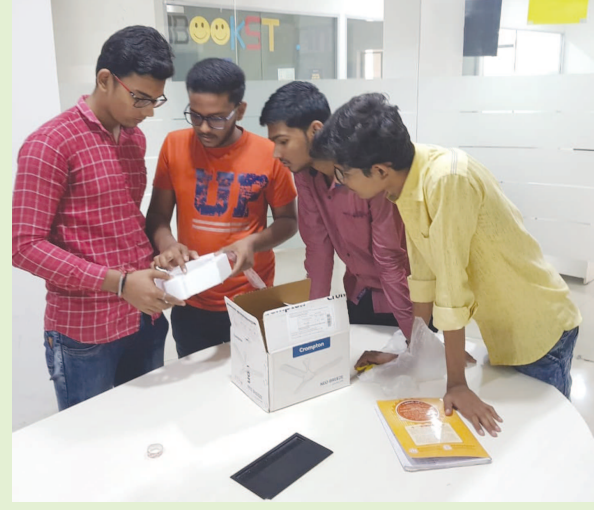
સ્વર્ણિમ સ્ટાર્ટઅપ એન્ડ ઇનોવેશન યુનિવર્સિટી દ્વારા સ્ટાર્ટઅપ એન્ડ ઇનોવેશન માટે વિદ્યાર્થીઓને પ્રોત્સાહિત અને માર્ગદર્શન આપવા ‘થિન્ક વિથ ધ બોક્સ’ ઈવેન્ટ યોજાઈ હતી. આ ઈવેન્ટ માં પહેલા વર્ષ ના કુલ ૧૬૦ થી વધુ વિદ્યાર્થીઓ એ ઉત્સાહપૂર્વક ભાગ લીધો હતો. આ ઈવેન્ટ ની શરૂઆત માં વિદ્યાર્થીઓને બોક્સ, પેન્સિલ, સ્કેચપેન, કાનર, પેપરશીટ, ગુંદર જેવી સામગ્રીઓ આપવામાં આવે છે અને ઓન ધ સ્પોટ તેઓને કોઈ પણ એક પ્રોડક્ટ વિચારીને તેનું પેકેજિંગ ડિઝાઇન કરીને પ્રોડક્ટ ની બાકીના વિદ્યાર્થીઓને માહિતી આપીને તેને યોગ્ય ભાવ માં માર્કેટિંગ કરીને વેચાણ કરવાનું હોય છે. જેમાં પ્રોડક્ટ માટેની ટેગલાઈન, લોગો, સ્લોગન, પ્રાઈઝ, ફીચર્સ વિગેરે પ્રોડક્ટના પેકેજિંગ પર લખવાનું હોય છે. આ ઈવેન્ટ યોજવા પાછળનો મુખ્ય હેતુ એ હતો કે વિદ્યાર્થીઓ, માત્ર નવીન વિચારો કેવલોપી કરીને માત્ર પ્રોડક્ટનું પેકેજ બનાવે તેટલું જ નહિ પરંતુ તેને યોગ્ય રીતે માર્કેટિંગ કરીને વેચાણ કરીને રેવન્યુ જનરેટ કરે તે હતો. અને ઉલ્લેખનીય છે કે, આજના વૈશ્વિક ઔદ્યોગિક ક્ષેત્ર માં મંદી નું જે વાતાવરણ ની જે અસર છે તેને નાથવા માટે તેમ જ વધુમાં વધુ લોકોને રોજગારી મળે તે માટે ભારત સરકાર એ ૨૦૧૫ માં સ્ટાર્ટઅપ ઈન્ડિયા ની શરૂઆત કરી હતી અને સ્ટાર્ટઅપ એ આજને યુવાનો માં ખુબ જ લોકપ્રિય અને પસંદગીનું કારકિર્દી સ્થાન પામ્યું છે. આજે યુવાનો કોર્પોરેટ નોકરી કરતા નાનો એવો ધંધો કરવાનું વધુ પસંદ કરે છે.