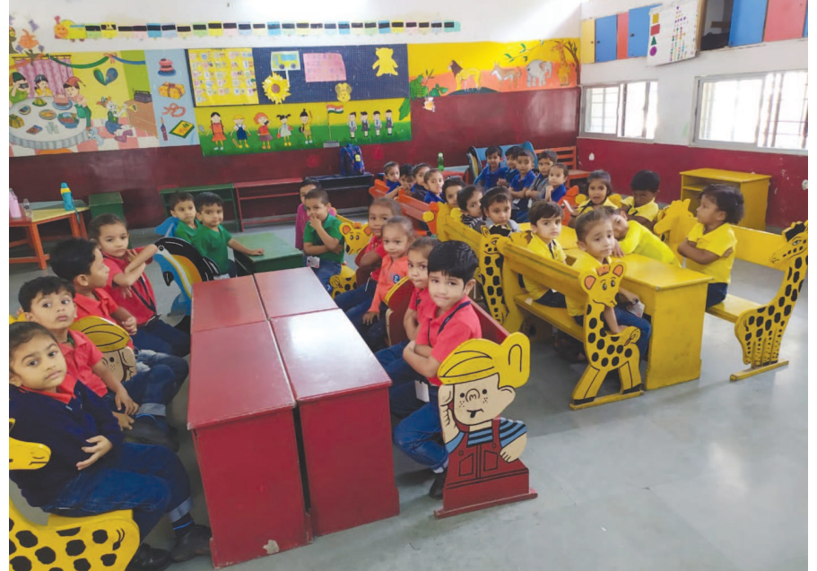
ગાંધીનગર ઈન્ટરનેશનલ પબ્લીક સ્કૂલ માં પ્રિ-પ્રાઈમરી વિભાગ ખાતે તાજેતરમાં 'Quiz competition'નું આયોજન કરવામાં આવ્યું હતું જેમાં G.K, English, અને Maths જેવા વિષયોને આવરી લેવામાં આવ્યા હતા. બાળકોએ આ કૉમ્પિટિશનમાં ઉત્સાહભરે ભાગ લીધો હતો.