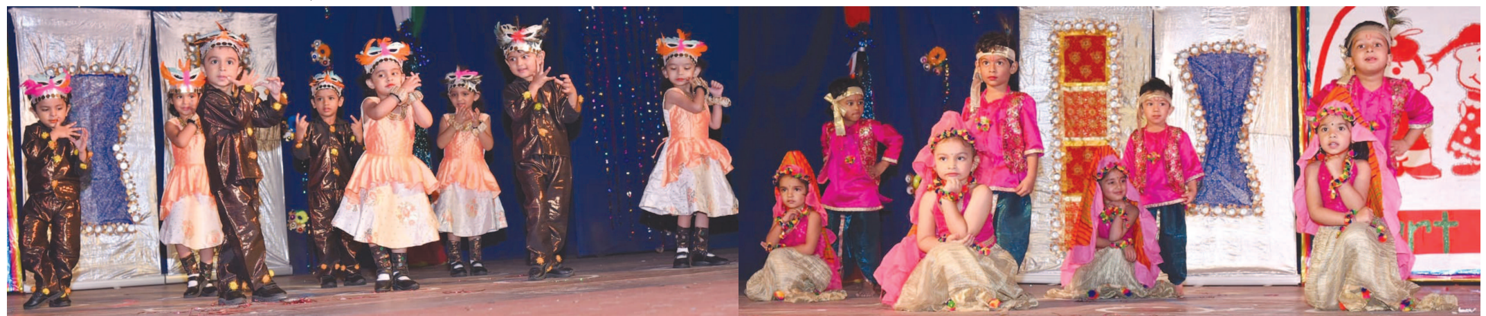
ગાંધીનગરના સેક્ટર-૧ ખાતે કાર્યરત સ્માર્ટ કિડ્સ નર્સરી સ્કૂલ દ્વારા વાર્ષિકોત્સવનું આયોજન ગાંધીનગર ટાઉનહોલ ખાતે કરવામાં આવ્યું હતું. 'વન્સ મોર' થીમ પર યોજાયેલા આ વાર્ષિકોત્સવમાં નાનાં બાળકોએ સુંદરતમ સાંસ્કૃતિક કૃતિઓની રજૂઆત કરીને આ કાર્યક્રમને યાદગાર બનાવી દીધો હતો. રંગબેરંગી વસ્ત્રોમાં સજજ બાળકોએ હોલમાં મનોહર દેશ્યોનું સર્જન કર્યું હતું. બાળકોના વાલીઓ મોટી સંખ્યામાં આ કાર્યક્રમને માણવા ઉપસ્થિત રહ્યા હતા.