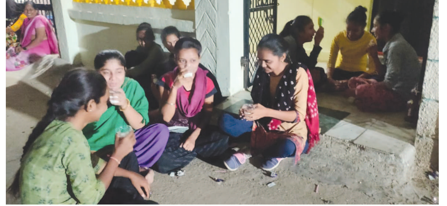
ડીસામાં શરદ પૂનમની ઉજવણી...

વાહનચાલકો માટે ભારે મુશ્કેલી સર્જાઈ છે. એક તરફ નવરાત્રી અને દિવાળીનો માહોલ હોઈ ઉડતી ધૂળ બંધ થઈ જતા શહેરીજનોને મહદઅંશે રાહત મળી હતી, પરંતુ ત્યારબાદ ફરીથી વાહનચાલકો માટે ભારે મુશ્કેલી સર્જાઈ છે. એક તરફ નવરાત્રી અને દિવાળીનો માહોલ હોઈ પામી છે, સતત વાહનોની અવરજવરના કારણે ટ્રાફિક જામ થઈ જતા ભારે મુશ્કેલી ઉભી થતી હતી તેમજ વાહનચાલકોને અકસ્માતનો પણ ભય સતતી રહ્યો છે એટલું જ નહીં શહેરનું વાતાવરણ ધુણિયું બની ચૂક્યું છે. સતત તહેવારો ટાણે ઉડતી ધૂળના કારણે રાહદારીઓ અને વાહનચાલકો પરેશાન થઈ ઉઠ્યા છે. રોડ ઉપર સતત ધૂળ ઉડતા સમગ્ર વાતાવરણ ધુણિયું બની જાય છે. શિયાળાના આગમન ટાણે ડીસાવાસીઓની મુશ્કેલીમાં વધારો થવા પામ્યો છે તેથી ડીસાવાસીઓમાં સવાલ ઉઠી રહ્યા છે કે એક તરફ ભુગર્ભ ગટરની કામગીરી પૂર્ણ થયા બાદ પણ વારંવાર આ માર્ગો ક્યાં કારણોસર ખોદી દેવામાં આવી રહ્યા છે? પ્રજાની સતત હેરાનગતિ સાથે પેસાનું પણ પાણી થઈ રહ્યું હોવાની ચર્ચાઓ પણ ચોમેર ઉઠવા પામી છે.