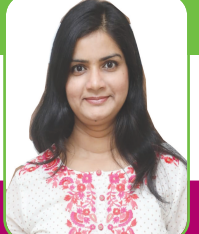
લવ યુ જિંદગી નિયતી કપડીયા

કોણ આવી ગઈ? અરે દિવાળી આવી ગઈ. ખરું જોતાં તો દિવાળી કરતાય દિવાળી પહેલાનાં થોડા દિવસો વધારે મજેદાર હોય છે. સાફ સફાઈથી લઈને ખરીદી સુધી મજા જ મજા. દિવાળીએ આમ કરીશું ને તેમ કરીશુંના સપના જોવાની મજા અને એથીય વધારે નવા વરસે શું છોડી દઈશું કે શું ચાલું કરીશું એ વિચારવાની મજા. ઘરમાં માળિયા ખુલ્યા હશે ત્યારે કેટલી બધી એવી વસ્તુઓ ઉપર ફરી તમારી નજર ફરી વળી હશે જે આપણને લાગે કામની છે, વરસોથી સંગ્રહી રાખી હોય અને એનું કામ જ ના પડતું હોય. આ વાત તમારે વધારે સારી રીતે સમજવી હોય તો પોતાના નહિ પણ બીજાના ઘરના મળીયાના કાટમાળ, માફ કરશો, સામાન પર નજર નાખવી. કેટલીય વસ્તુ જોઈને તમને એકવાર તો એવો વિચાર આવી જ જશે, “કેટલા કંજૂસ લોકો છે. સાવ નક્કામી વસ્તુ સંગ્રહી રાખે છે. કંઈ કંઈક એમનો જીવ જ ના ચાલે!” આવી આપણને નક્કામી લાગે પણ એમના માટે બહુ કામની વસ્તુ એટલે બાળકોના રમકડાં, પાપડ વગવાનો સંચો, સેવો પાડવાનું મશીન, જૂના જમાનાનું મોટું જમ્બો સાઈડનું ડોકળીયું, ત્રણ મોટા ડબ્બાવાળું એલ્યુમિનિયમનું કુકર, મોટા મોટા ટોકર, જૂના તેલના ડબ્બા વાળા લોખંડના ડબ્બા, મોટી મોટી સફેદ અથાણાં ભરવાની બરછીઓ, તૂટેલી છત્રીઓ...લીસ્ટ ઘણું લાંબુ થઈ શકે. આ બધી એવી વસ્તુઓ