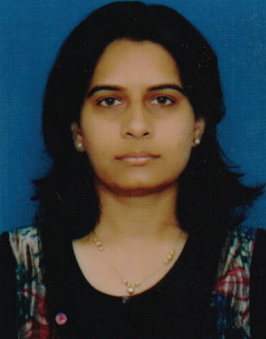
દિગંધા ગજજર લાયોનેસ ક્લબ