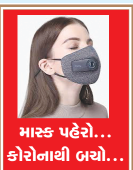
માસ્ક પહેરો... કોરોનાથી બચો...