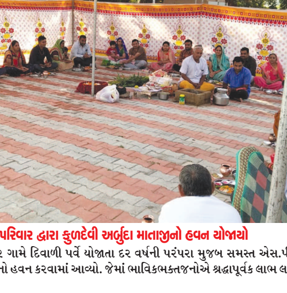
કાનપુર ગામે સમસ્ત એસ.પી. પરિવાર દ્વારા કુળદેવી અર્બુદા માતાજીનો હવન યોજાયો

નગરજનોએ અમદાવાદ સુધી લાંબા થયું પડે છે. જ્યારે નગરજનોના આ હાડમારીમાંથી ઉગારવા માટે આ ઉપરાંત હોટલ બાંધકામનું બાકી રહેતું કામ પણ પુર્ણતાના આરે છે ત્યારે પ્લેટફોર્મ નં-૧ અને ૨ પર ટ્રેન સેવા શરૂ કરવામાં આવી રહી છે. ટ્રેન સેવા હોવાના લીધે હાલ