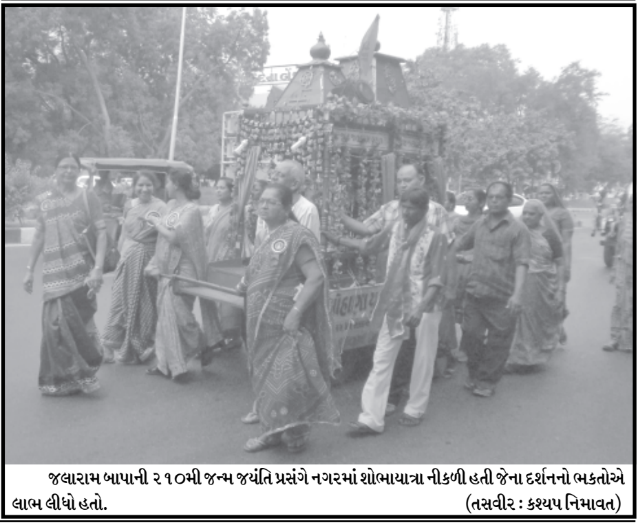
જલારામ બાપાની ૨૧૦મી જન્મ જયંતિ પ્રસંગે નગરમાં શોભાયાત્રા નીકળી હતી જેના દર્શનનો ભકતોએ લાભ લીધો હતો.

પરિવારની બહેનો દ્વારા વિવિધ જાતની મિઠાઈ, ફરસાણ, શાકભાજી, મુખવાસ મોઢે માસ્ક પહેરી અત્યંત પવિત્ર વાતાવરણમાં બનાવી સવારે ૯-૦૦ કલાકે રથેશ્વરી માતાજીને છપ્પન ભોગ અન્નકૂટ હૃદયના શુદ્ધ ભાવથી ધરાવવામાં આવ્યો. પરિવાર દ્વારા આ સિવાય વર્ષ દરમિયાન સમયાંતરે વિવિધ રોગ નિદાન શિબિર વ્યસન મુક્તિ અભિયાન, પ્રતિ માસની પૂનમે