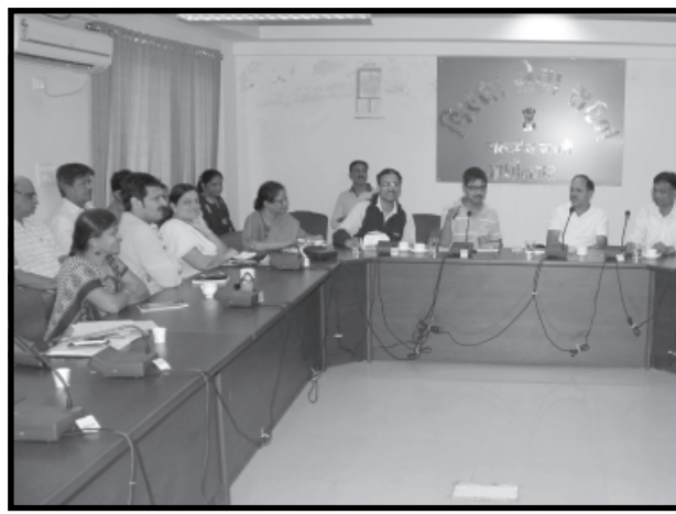
વિદેશમાંથી મોટી સંખ્યામાં ડેલીગેટ્સ આવવાના છે. ત્યારે રાજ્યના પાટનગરની સ્વચ્છતા મહત્વની ભૂમિકા અદા કરશે.