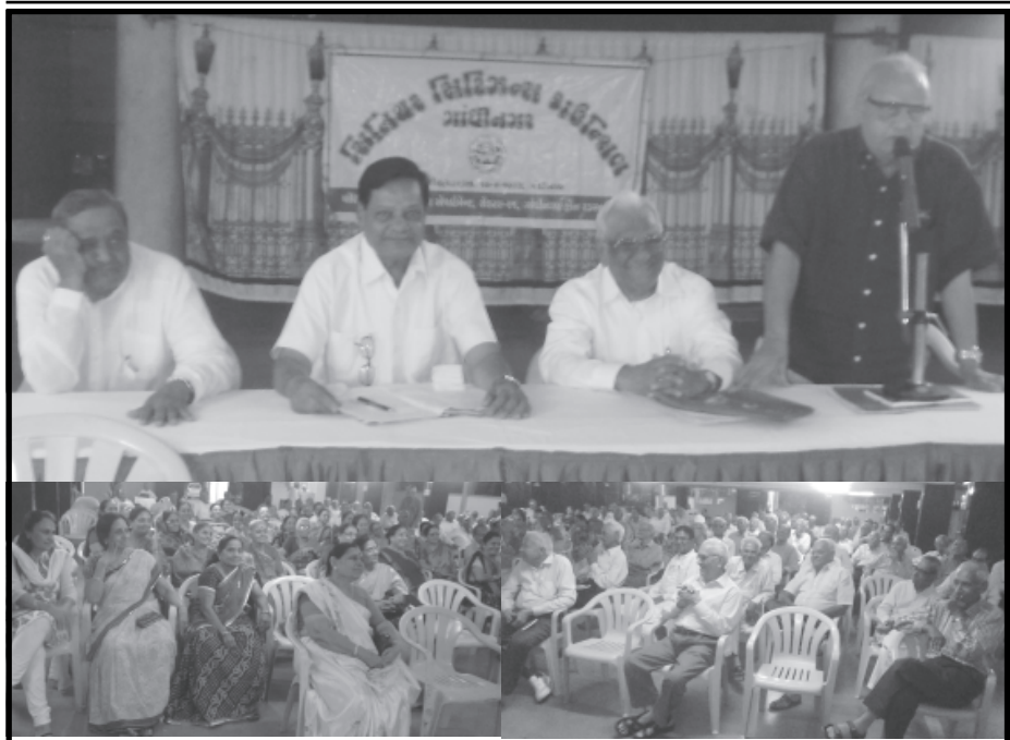
સિનિયર સિટીઝન કાઉન્સિલ દ્વારા સેક્ટર-૭ સોરાષ્ટ્ર લેઉઆ પટેલ વાડી ખાતે સ્નેહમિલન કાર્યક્રમ રાખવામાં આવ્યો હતો. જેમાં મોટી સંખ્યામાં સભ્યો ઉપસ્થિત રહ્યા હતા.

સે-૨માં રહેતા પતિ-સસરા સામે ડભોડા પોલીસ સ્ટેશનમાં ગુનો દાખલ ગાંધીનગર, તા. ૩૧ ગાંધીનગર શહેરના સેક્ટર-૨માં રહેતા પતિ અને સસરા લગ્ન બાદ પરિણીતા પાસે રૂ. ૫ લાખની દહેજની માંગણી કરી દહેજ ન આપતા અવાર નવાર મારઝુડ કરી ત્રાસ ગુજરતા હોવા અંગેની ફરીયાદ ડભોડા પોલીસ મથકમાં નોંધાવા પામી છે. ડભોડા પોલીસે પતિ અને સસરા સામે શારિરીક-માનસિક ત્રાસ અને