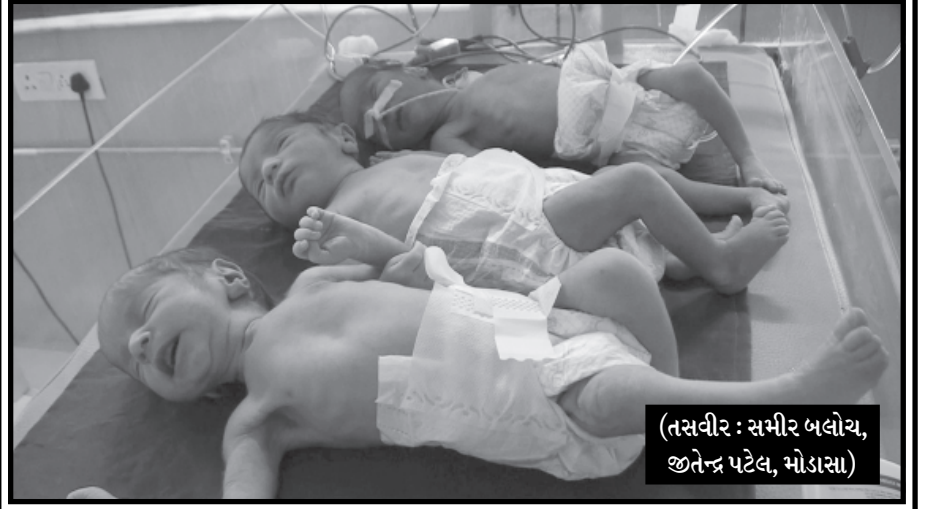
(તસવીર : સમીર બલોચ, જીતેન્દ્ર પટેલ, મોડાસા)

પરિવાર અંતે ખુબ નિરાશ બન્યું હતું. ત્યારે મોડાસાના સ્ત્રીરોગ નિષ્ણાંત દ્વારા સરકારની યોજના અમારૂં બાળક વિશે જાણ થતા આ પરિવાર દ્વારા રાજસ્થાનથી મોડાસામાં આવી ટેસ્ટ ટ્યુબ બેબી પદ્ધતિથી સારવાર લેવાનું શરૂ કર્યું હતું. લાંબી સારવાર બાદ આજે રાજસ્થાનની