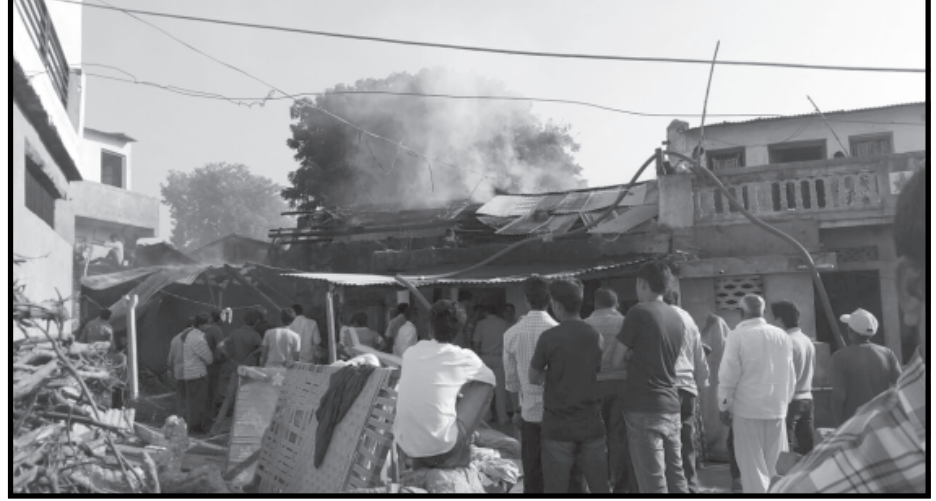
દીધી હતી. આ આગ દુર્ઘટનામાં પૂળા, ઘરવખરી, સહિતનો સામાન બળીને ખાખ થઈ જવા પામ્યો હતો.

સાથે પહોંચી ગયા હતા અને પાણીનો મારો ચલાવી આગને કાબુમાં લઈ લીધી હતી. આ આગ દુર્ઘટના કેવી રીતે સર્જઈ તે હજુ રહસ્ય છે. તો બીજા તરફ આગ દુર્ઘટનામાં ૧૮૦૦ જેટલા પુળા, ઘરવખરીનો સામાન, અનાજ-કરીયાણુ સહિતનો અંદાજે બે લાખનો સામાન બળીને ખાખ