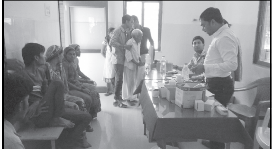
ગાંધીનગર, તા. ૨૬ ગાંધીનગર તાલુકાના સોનારડા ગામે આજે પણ ઝાડા-ઉલ્ટીના કેસો

ઝાડા-ઉલ્ટીના વધુ ૮ કેસ મળ્યા અને પાણીના વધુ પાંચ લિટર ધ્યાનમાં આવ્યા : ગામની જુની પાઈપલાઈનનો સત્વરે બદલવા જિલ્લા પંચાયત પ્રમુખ હીનાબેનનો આદેશ