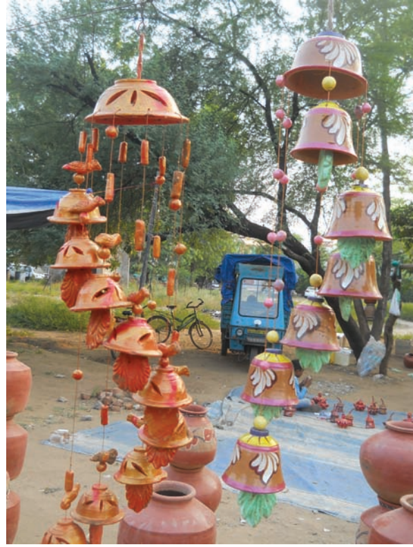
સુશોભન - દિવાલની પર્વોને વધાવવા સુશોભનના વૈવિધ્યસભર વસ્તુઓ બજારમાં છલકાય છે... માટીના અવનવા પ્રકારોથી સુશોભનની ચીજવસ્તુઓ બનાવાઈ છે... સંપૂર્ણ ગ્રામીણ માહોલ અને પરંપરાગત સંસ્કૃતિની અનુભૂતિ કરાવતી આકર્ષક ચીજવસ્તુઓની તસવીર શહેરમાં ગામઠી અનુભૂતિ કરાવે છે...

ગાંધીનગર, તા. ૪ ગાંધીનગર શહેરમાંથી રમાં ૧૫ વર્ષીય યુવકને આજે ડેન્ડ્યુ કક્કર્મ આવતાં તંત્ર દોડધામમાં વ્યસ્ત થઈ જવા પામ્યું છે. શહેરમાં એન્ટી લારવેલની