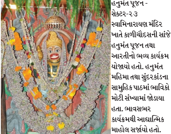
હનુમંત પૂજન - સેક્ટર-૨૩ સ્વામિનારાયણ મંદિર ખાતે કાળીચૌદસની સાંજે હનુમંત પૂજન તથા આરતીનો ભવ્ય કાર્યક્રમ યોજાયો હતો. હનુમંત મહિમા તથા સુંદરકાંડના સામુહિક પાઠમાં ભાવિકો મોટી સંખ્યામાં જોડાયા હતા. ભાવસભર કાર્યક્રમથી આઘાત્મિક માહોલ સર્જાયો હતો.