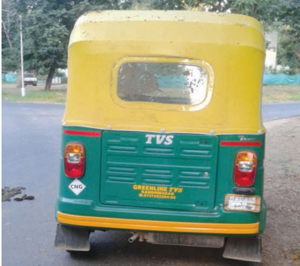
સેક્ટર-૧૯ની પૂછપરછ કરેરી પાસે એક રીક્ષા દિવસોથી બિનવારસી હાલતમાં પડી રહી છે. રીક્ષાનો કામચલાઉ રજિસ્ટ્રેશન નંબર (ટીસી) આછો થઈ ગયેલો જોઈ શકાય છે. મતલબ કે રીક્ષા નવી હાલતમાં જ છે. આ રીક્ષા કોની હશે એ બાબતે આસપાસના રહીશો ચર્ચા કરી રહ્યા છે. જો સત્વરે આ રીક્ષાનો માલિક નહીં મળી આવે તો પોલીસને જાણ કરવાની વિચારણા પણ સ્થાનિક નાગરિકો કરી રહ્યા છે.