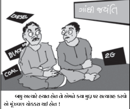
બાપુ અત્યારે હવ્યાત હેલત તે એમને કયા મુદ્દા પર સત્યાગ્રહ કરવો એ મૂંઝવણ ચોકસ સર્જ હેલત !