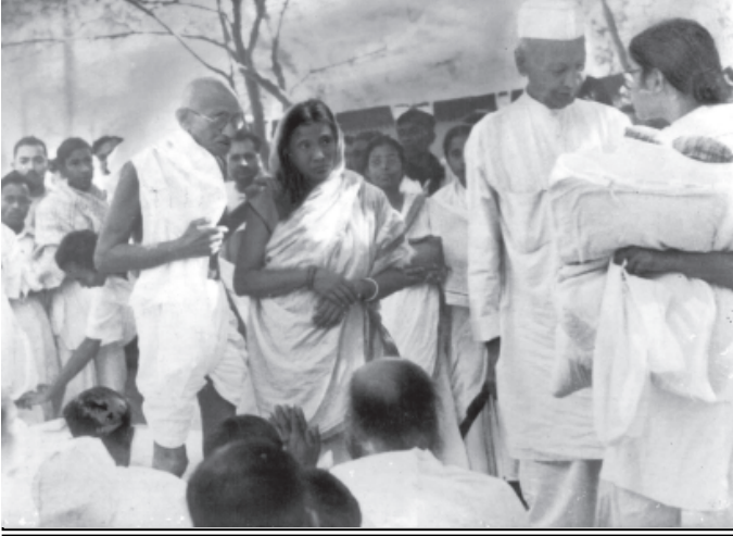
મિનિટ મોડા આવા બાપુ તરત બોલી ઊઠ્યા, 'મિનો આપણે આગાહી મેળવવા સંકલ્પ લીએ. પરંતુ આ આગાહી પંદર મિનિટ મોડી મળશે.' આમ મોડા આવવાની મીઠી ટકોર કરી સમયપાલનનો પાઠ બાપુએ સૌને આપી ગયા હતા. પરંતુ એક નેતા પંદર શીખવ્યો.

આજે ૨ ઓક્ટોબર. આપણા પૂજ્ય બાપુનો જન્મદિવસ. આજે વિશ્વ તેમને વંદી રહ્યું છે તથા તેમના સિદ્ધાંતોને માર્ગે ચાલવા પ્રતિજ્ઞા લઈ રહ્યું છે ત્યારે જીવનના કેટલાક રમુજ છતાં પ્રેરક પ્રસંગો પ્રસ્તુત કરું છું. એકવાર બાપુ ટ્રેનમાં મુસાફરી કરતા હતા ત્યારે તે ડબ્બાના દરવાજે ઉભા રહી બહારનો નાજારો માણી રહ્યા હતા. અચાનક તેમના એક પગનું સ્લીપર નીચે પડી ગયું. તરત તેમણે બીજું પાણી ફેંકી દીધું. કોઈકે પૂછ્યું, કેમ આમ કર્યું? બાપુ હસીને બોલ્યા, આમ પણ એક સ્લીપર મને તો કામ જ ન લાગત. હવે જેને પડી ગયેલું એક સ્લીપર મળે તેને જો બીજું મળે તો તેને તો કામ લાગે ને!